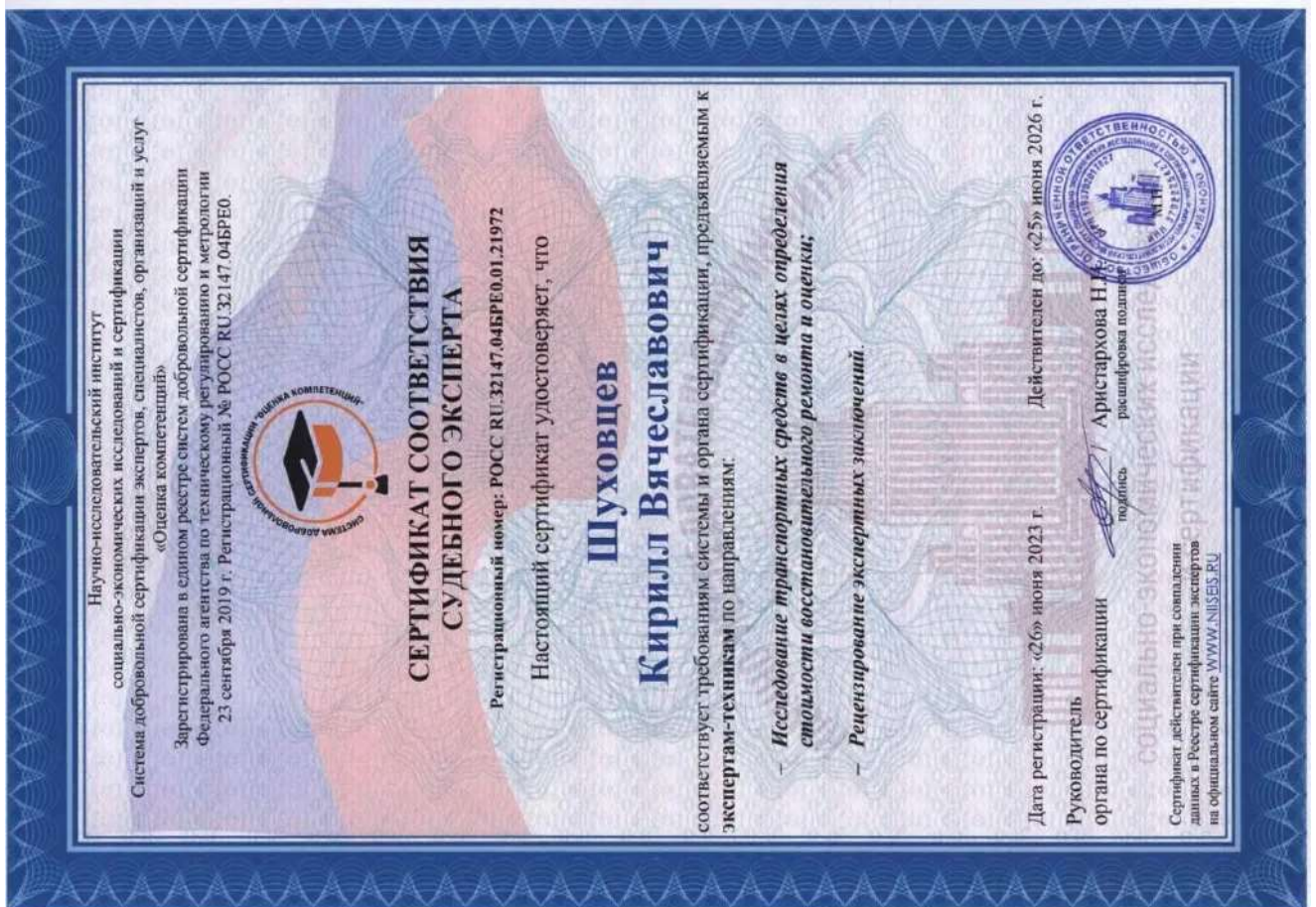
Сертификат соответствия судебного эксперта