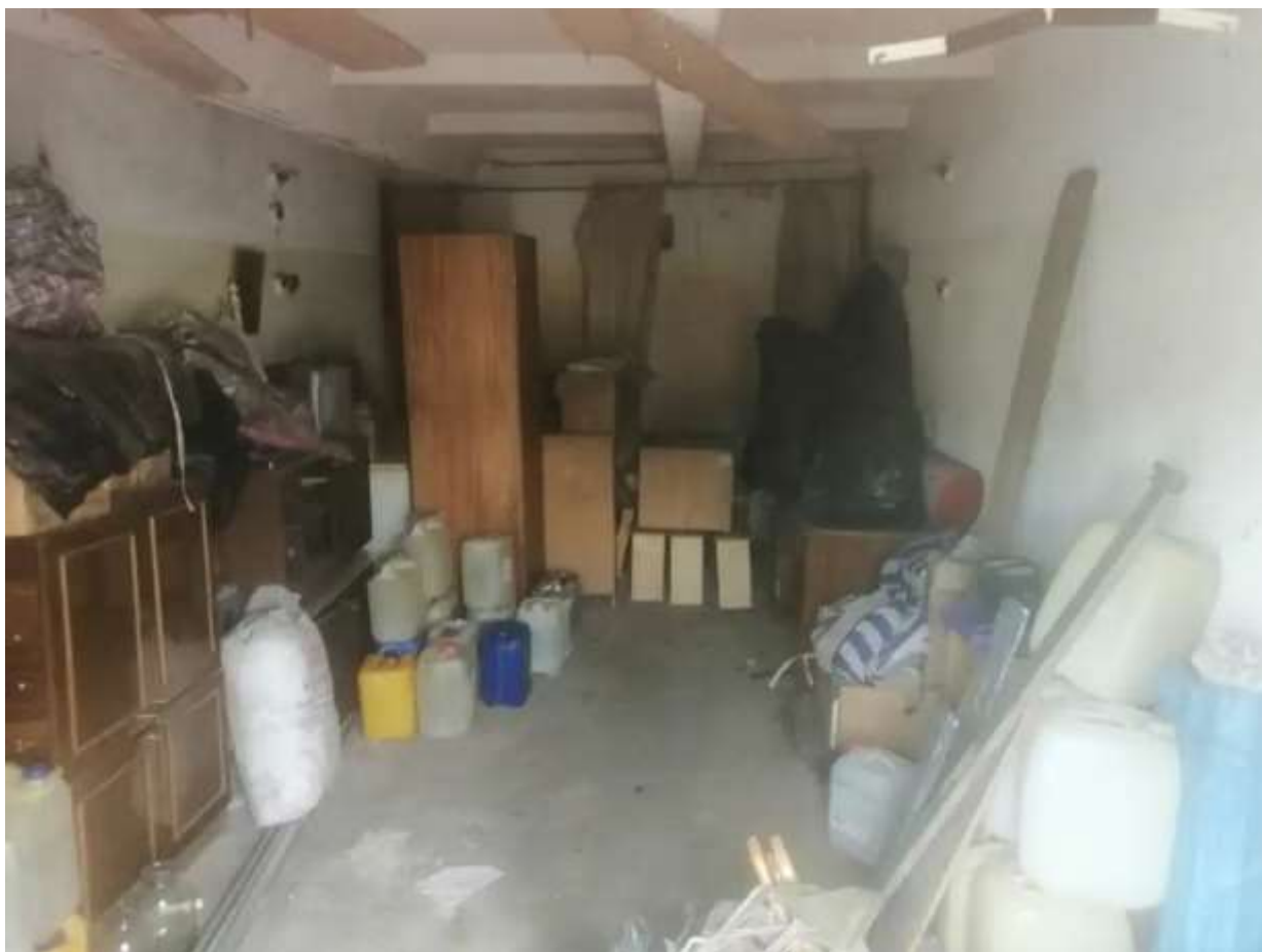
Фото №2. Общий вид гаража