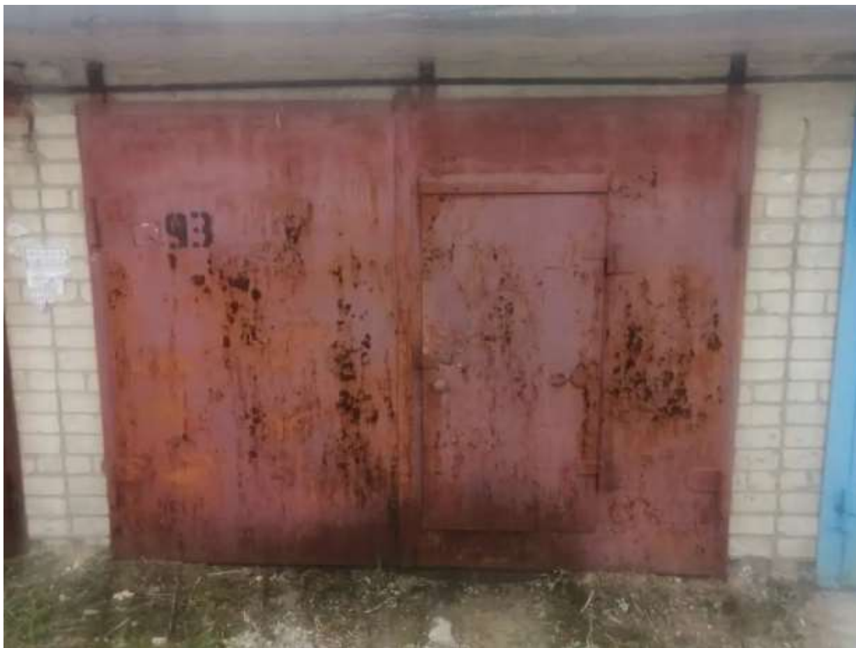
Фото №1. Общий вид гаража