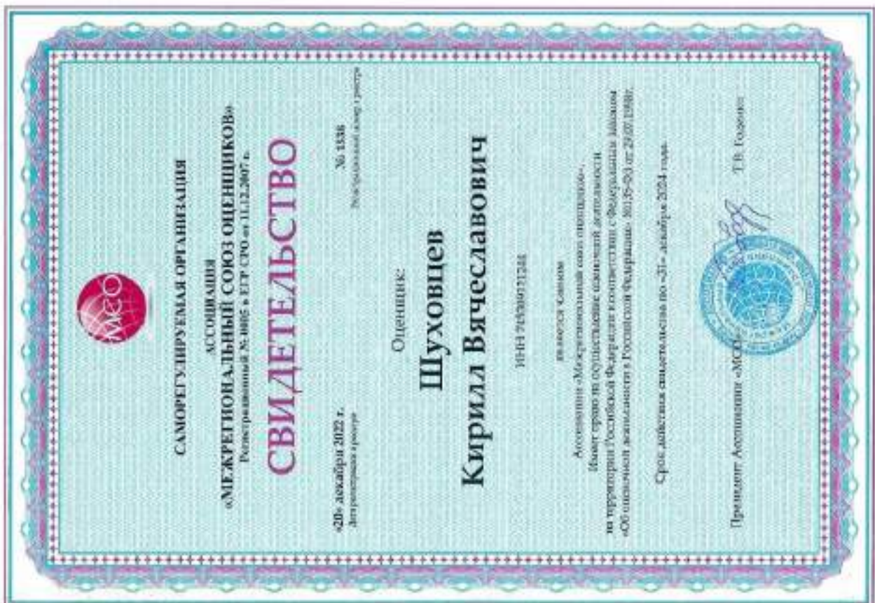
Свидетельство СРО оценщика