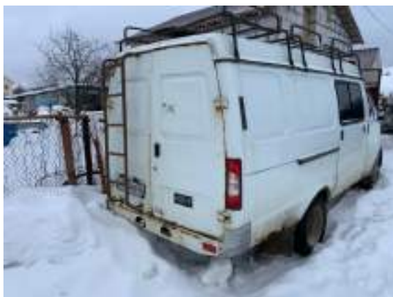
Фото №1. Общий вид