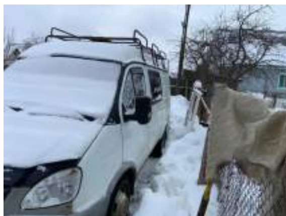
Фото №4. Общий вид