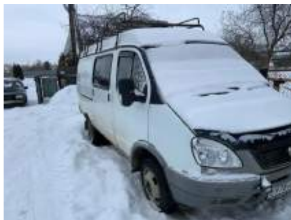
Фото №2. Общий вид