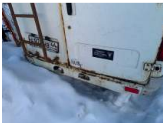
Фото №6. Дефекты эксплуатации