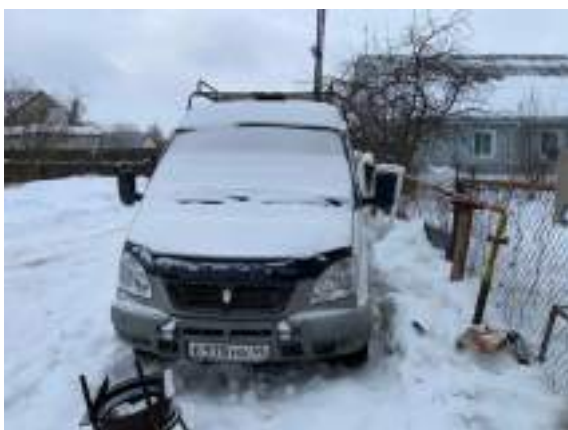
Фото №3. Общий вид