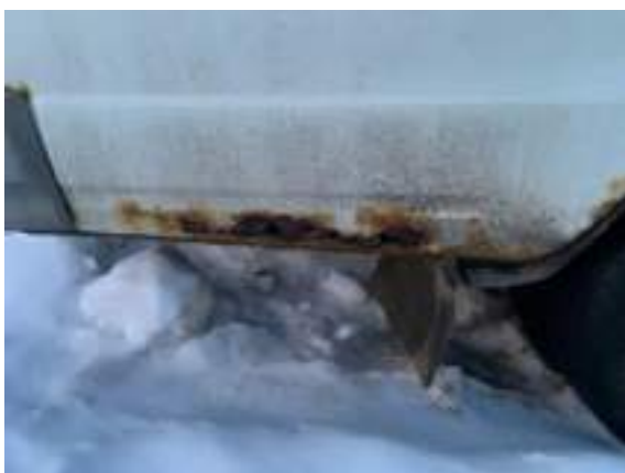
Фото №7. Дефекты эксплуатации