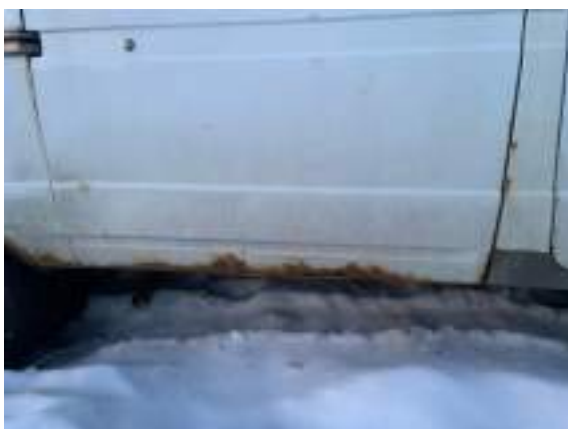
Фото №5. Дефекты эксплуатации