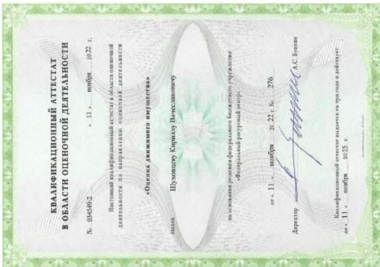
Квалификационный аттестат. Оценка движимого имущества