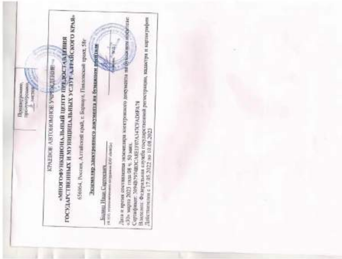
Выписка из ЕГРН