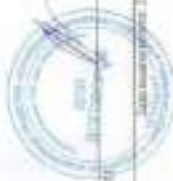
Полис страхования ответственности оценщика