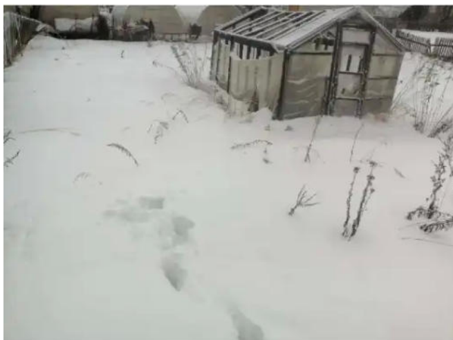
Фото №3. Общий вид участка