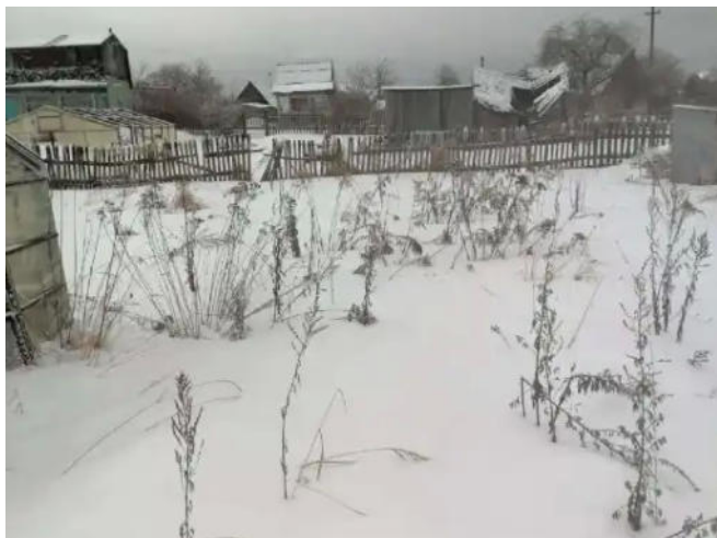
Фото №1. Общий вид участка