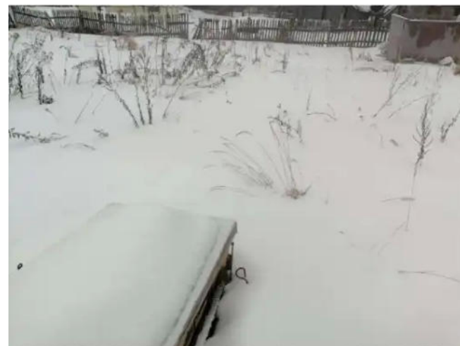
Фото №4. Общий вид участка