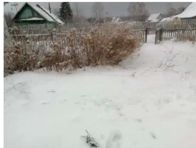
Фото №2. Общий вид участка