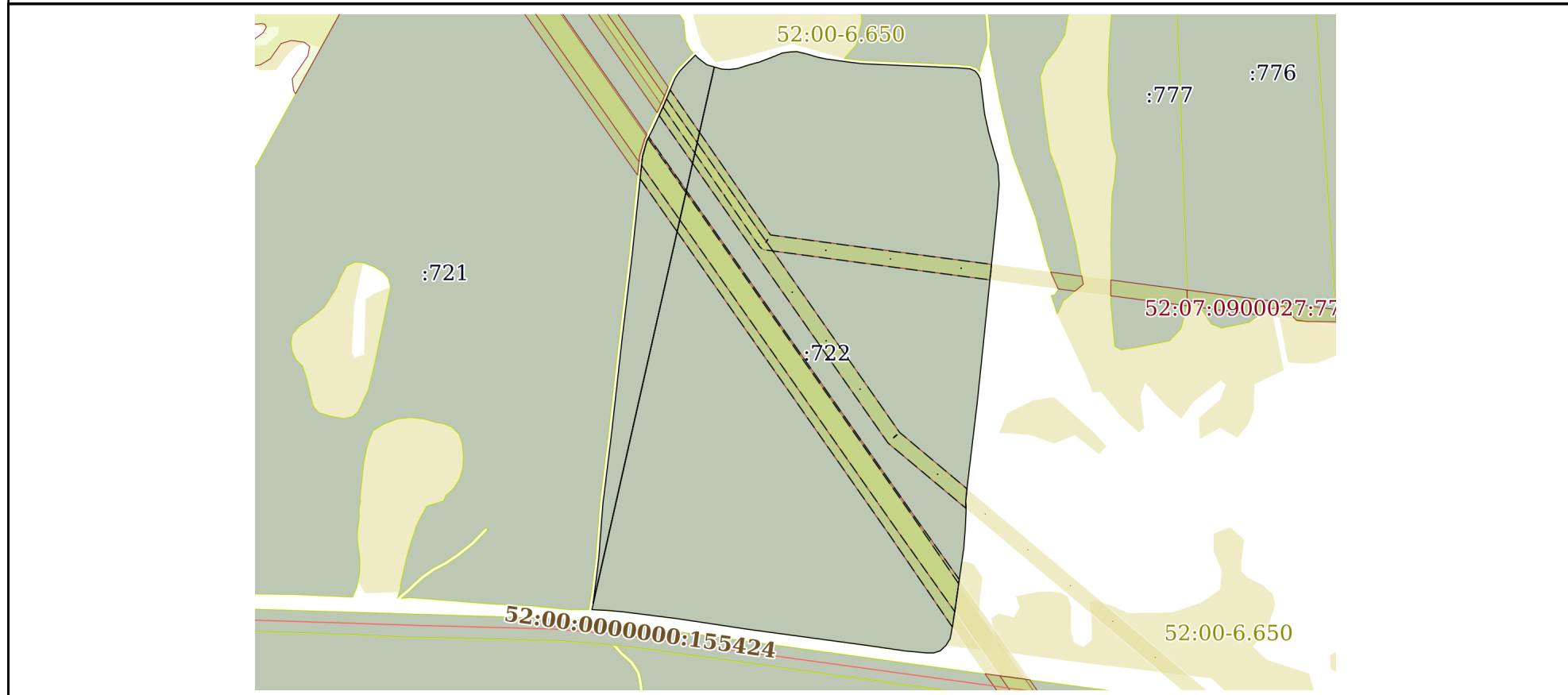
План (чертеж, схема) земельного участка