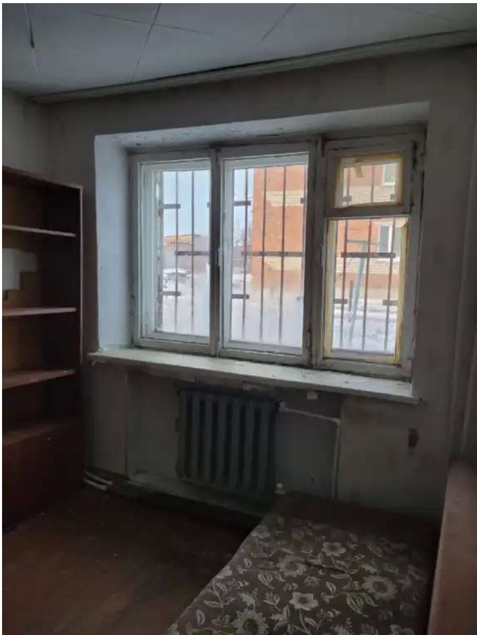
Фото №1. Общий вид квартиры