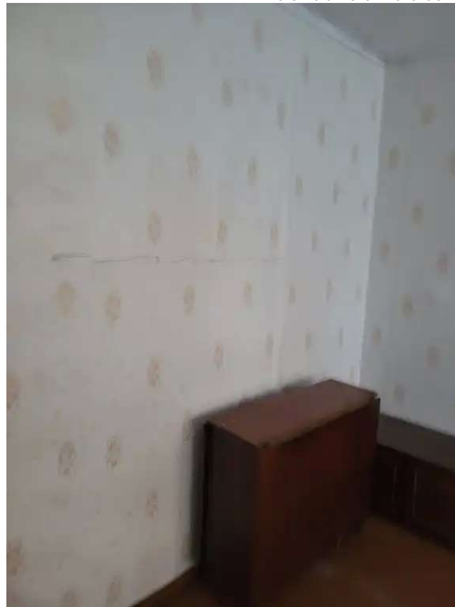
Фото №2. Общий вид квартиры