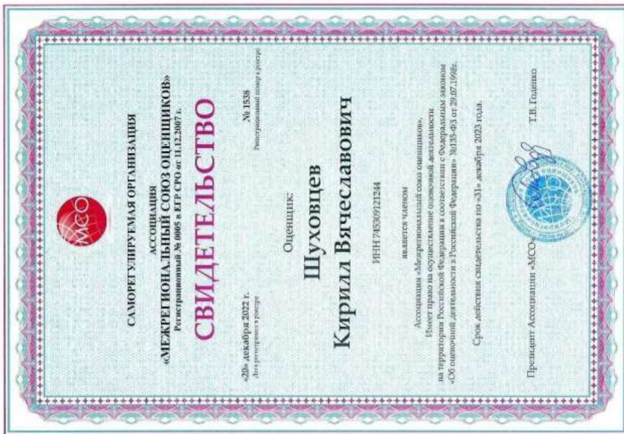
Свидетельство СРО оценщика