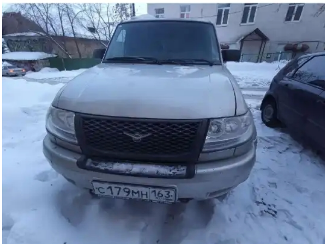
Фото №2. Фото ТС