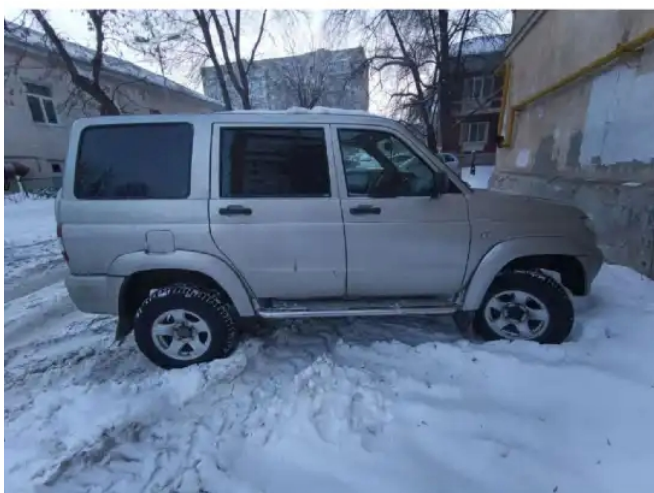
Фото №4. Фото ТС