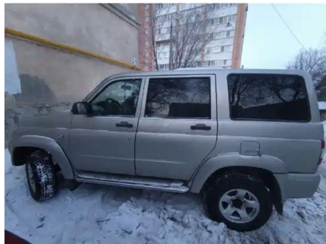
Фото №3.