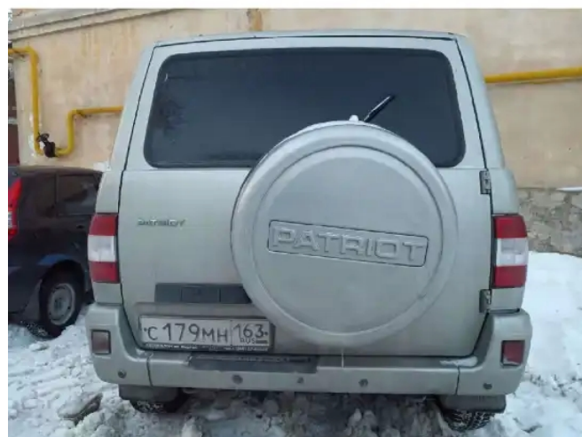
Фото №5. Фото ТС