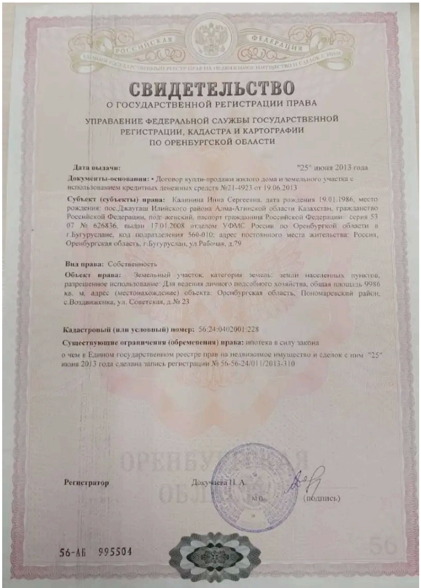
Свидетельство о государственной регистрации права