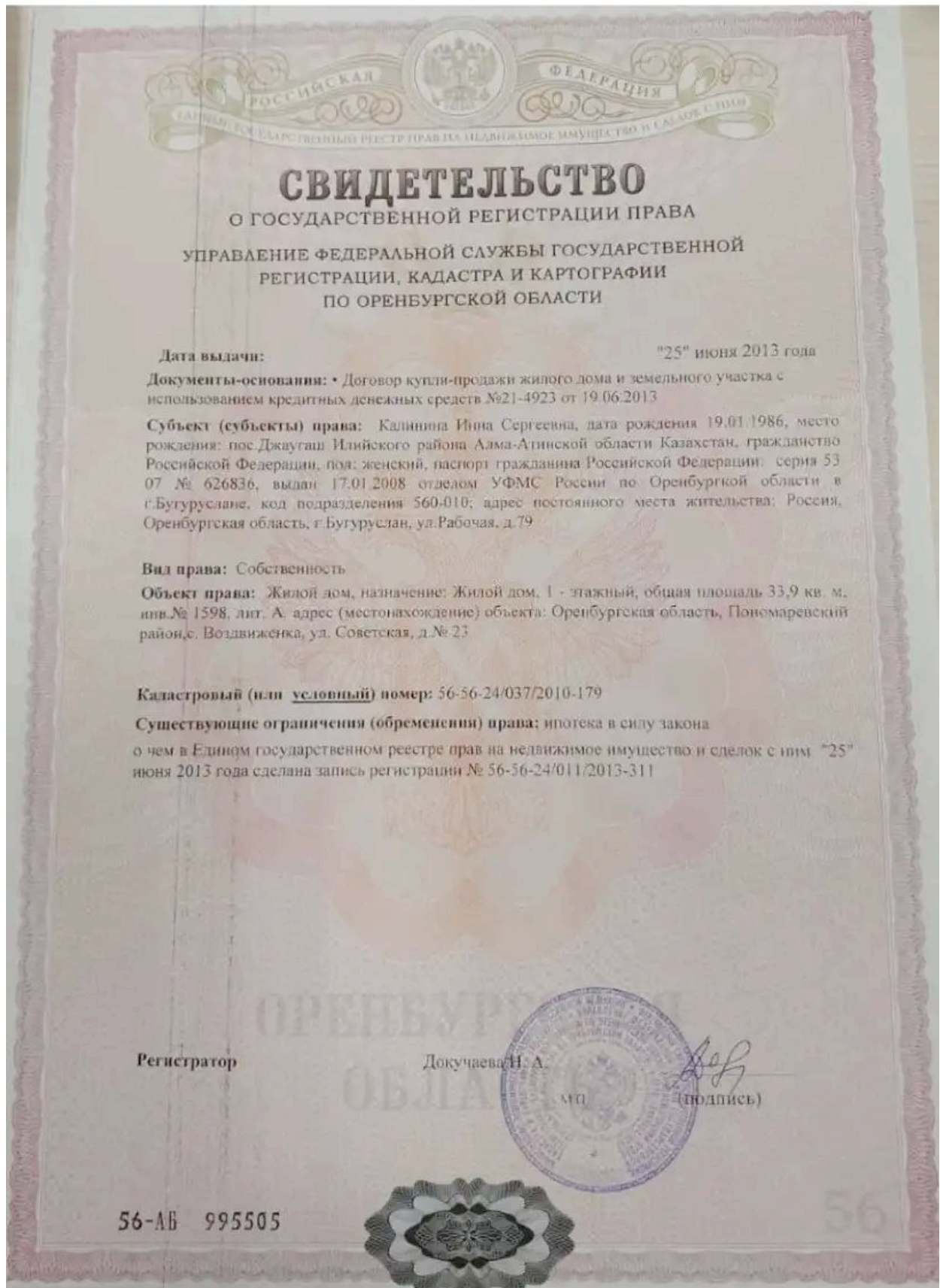
Свидетельство о государственной регистрации права