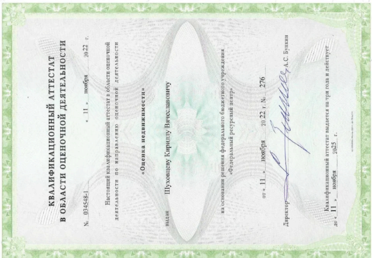
Квалификационный аттестат. Оценка недвижимости