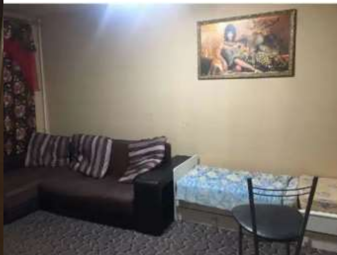
Фото №4. Комната