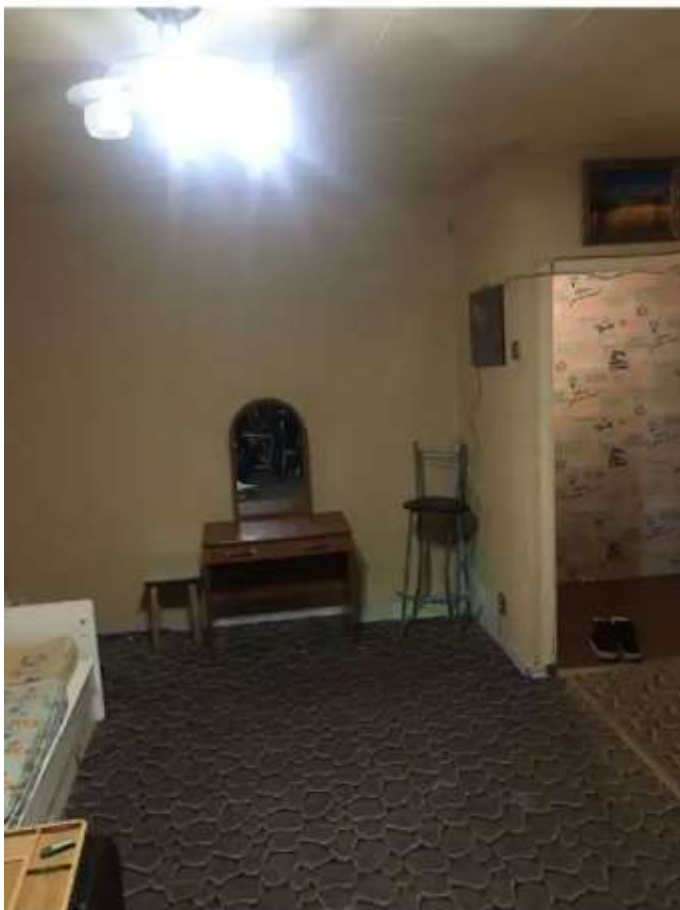
Фото №1. Комната