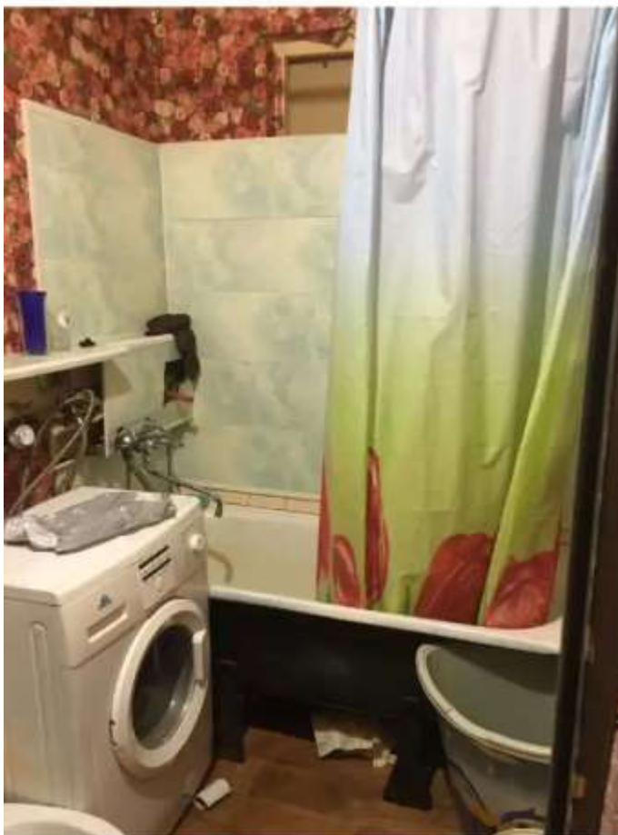
Фото №3. Санузел