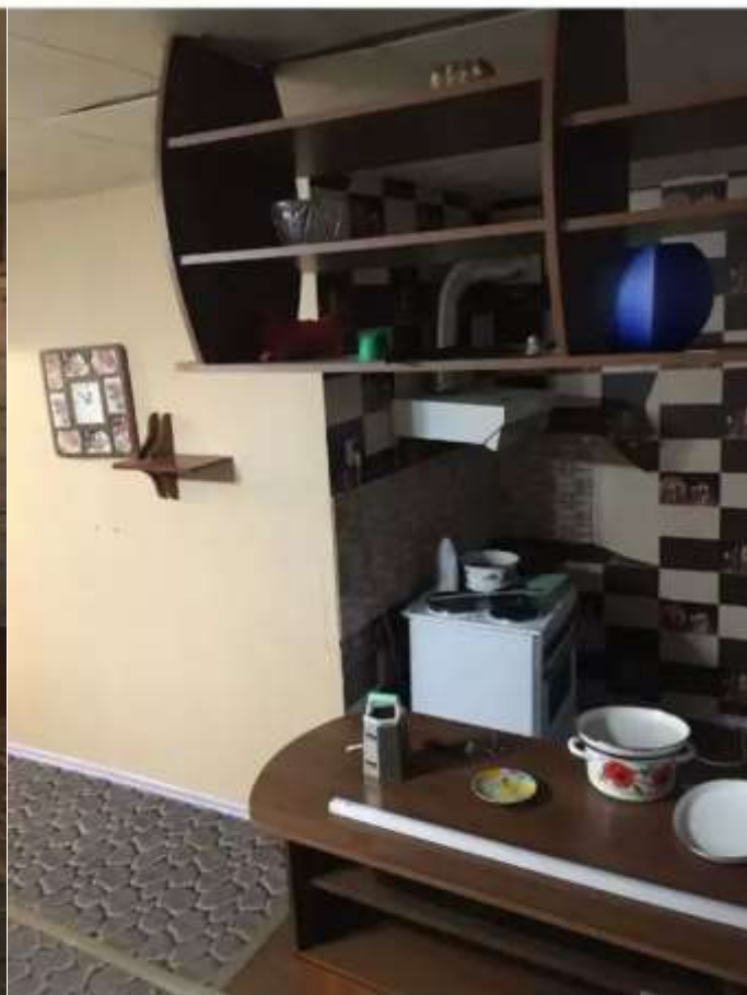
Фото №2. Комната