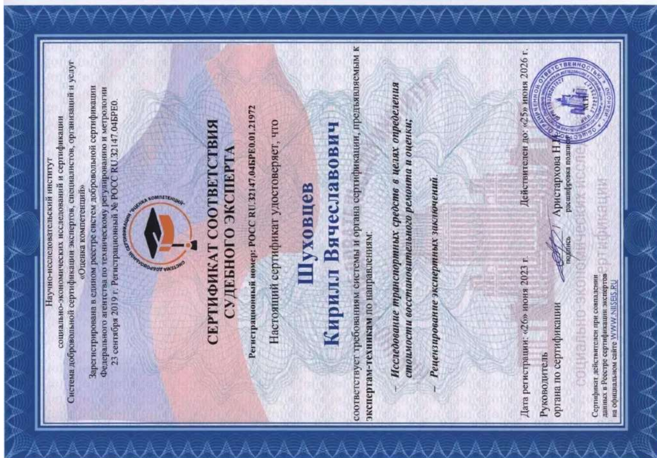
Сертификат соответствия судебного эксперта