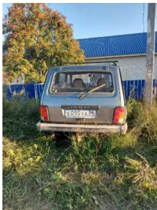
Фото №1. Общий вид