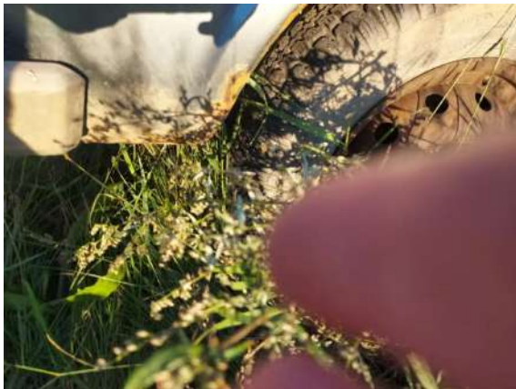
Фото №13. Дефекты эксплуатации