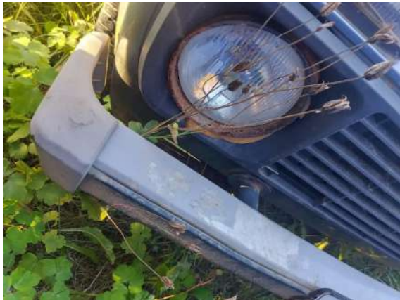
Фото №19. Дефекты эксплуатации