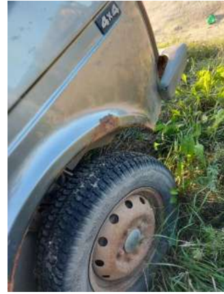
Фото №10. Дефекты эксплуатации