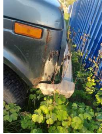
Фото №18. Дефекты эксплуатации