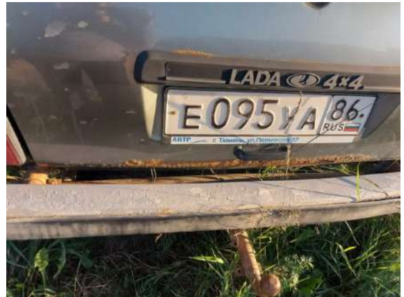
Фото №12. Дефекты эксплуатации