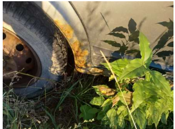
Фото №14. Дефекты эксплуатации