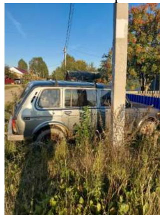
Фото №2. Общий вид