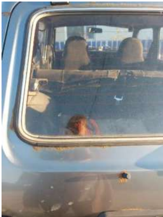
Фото №11. Дефекты эксплуатации