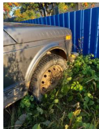
Фото №16. Дефекты эксплуатации