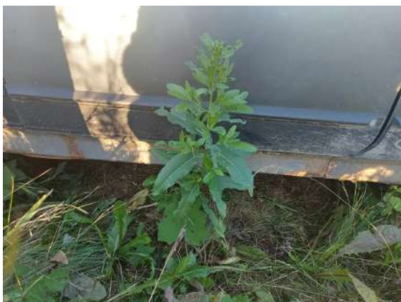
Фото №15. Дефекты эксплуатации