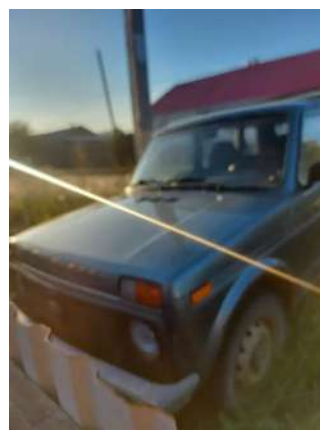
Фото №4. Общий вид