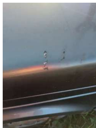
Фото №6. Дефекты эксплуатации