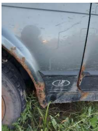
Фото №7. Дефекты эксплуатации