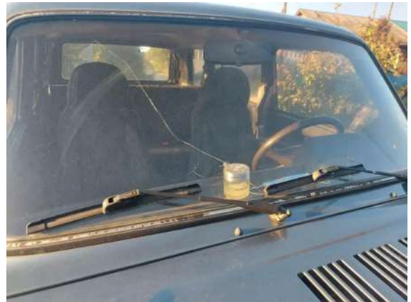
Фото №20. Дефекты эксплуатации