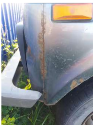
Фото №5. Дефекты эксплуатации