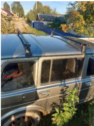
Фото №21. Дефекты эксплуатации