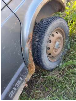
Фото №9. Дефекты эксплуатации