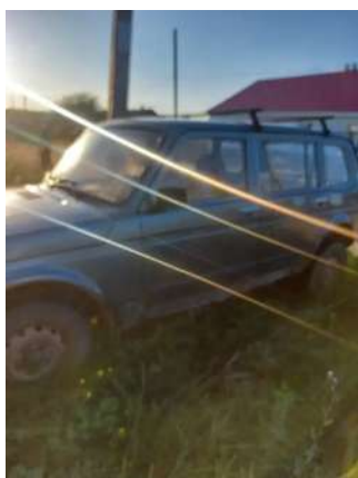
Фото №3. Общий вид