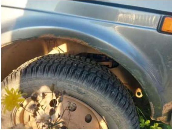
Фото №17. Дефекты эксплуатации