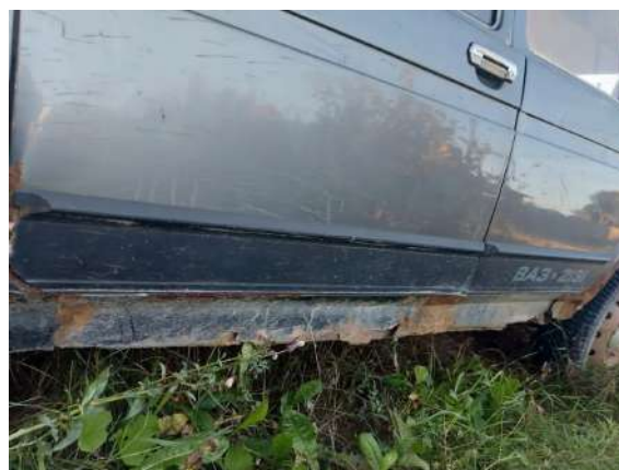
Фото №8. Дефекты эксплуатации