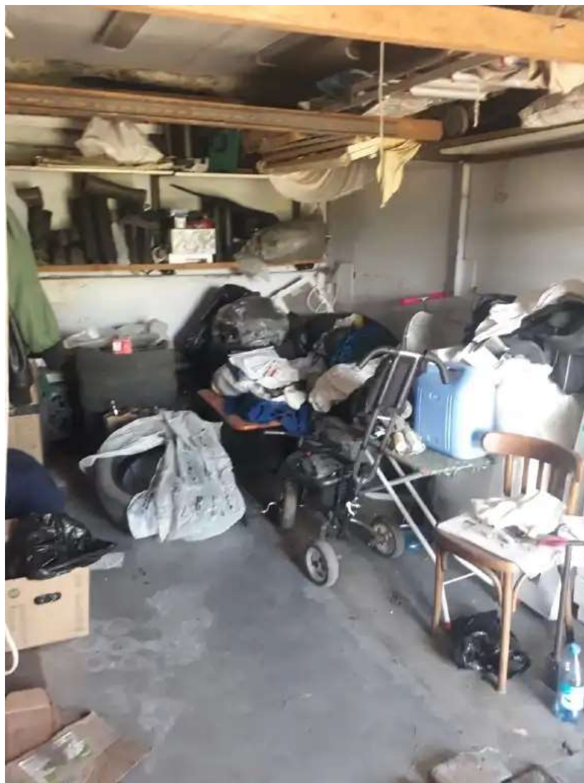
Фото №1. Общий вид гаража