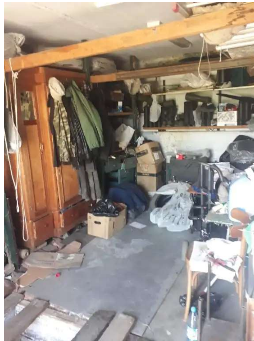
Фото №2. Общий вид гаража