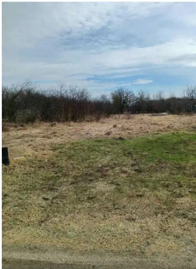
Фото №1. Общий вид