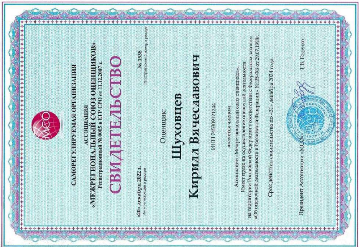
Свидетельство СПО оценщика