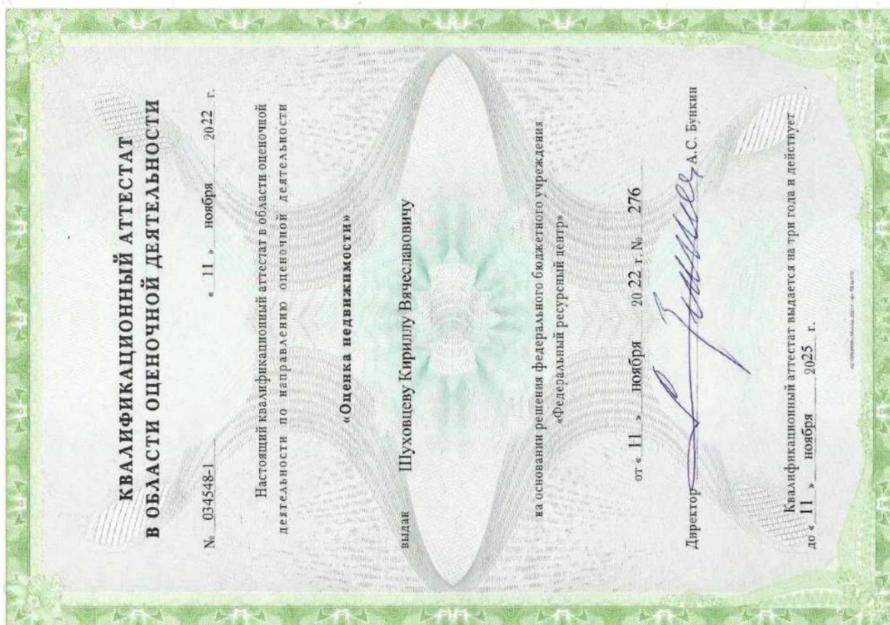
Квалификационный аттестат. Оценка недвижимости