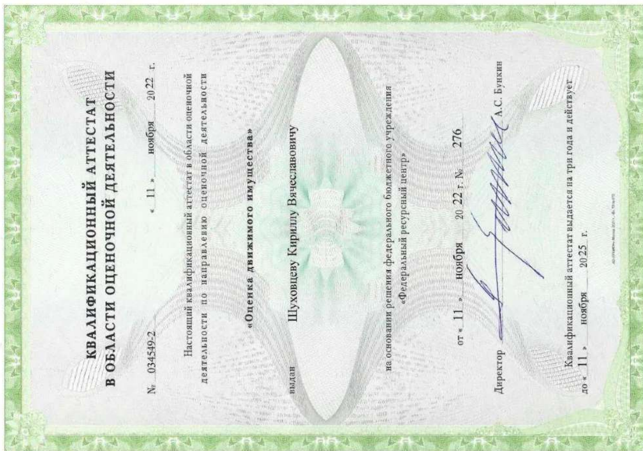
Квалификационный аттестат. Оценка движимого имущества