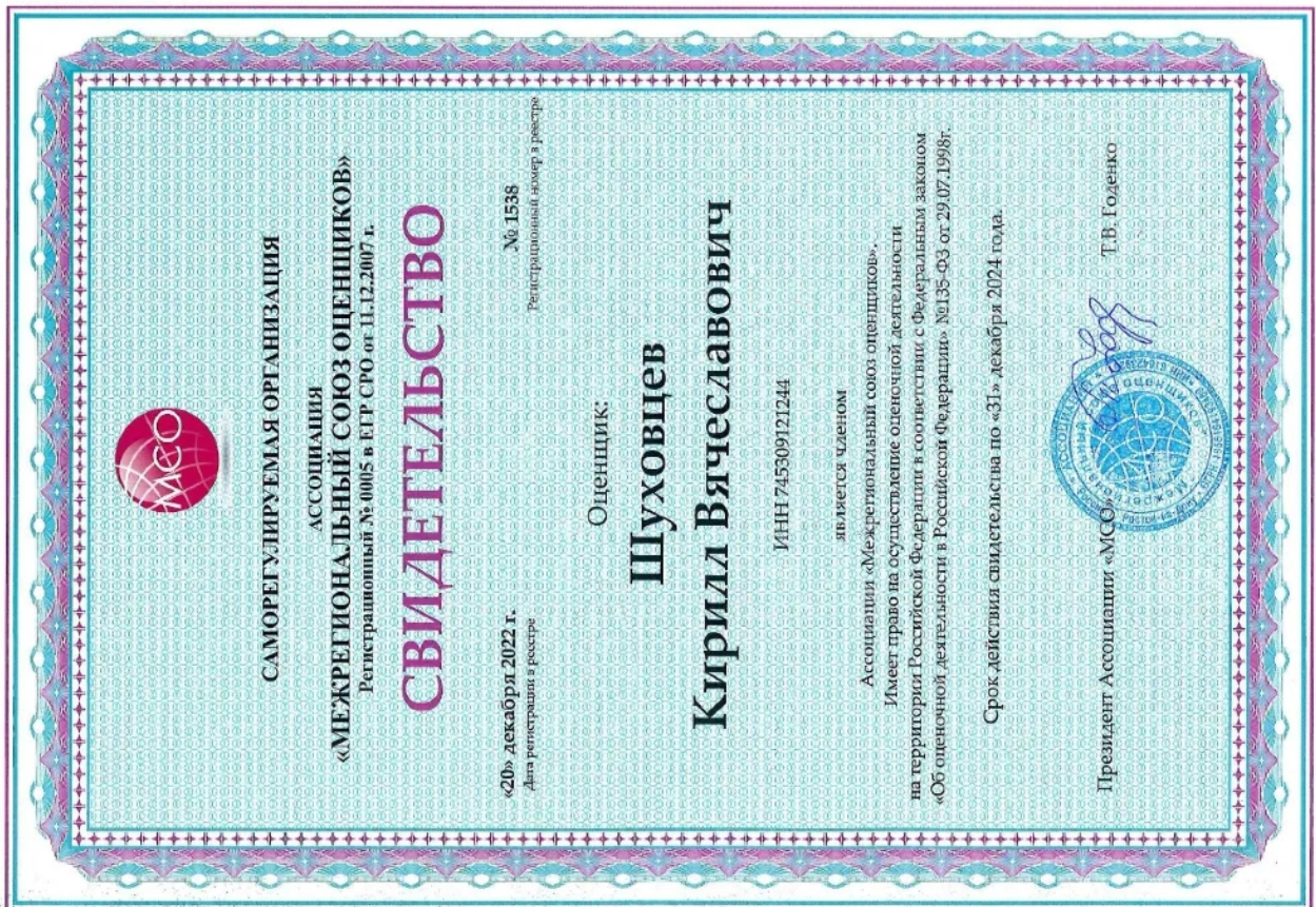
Свидетельство СПО оценщика