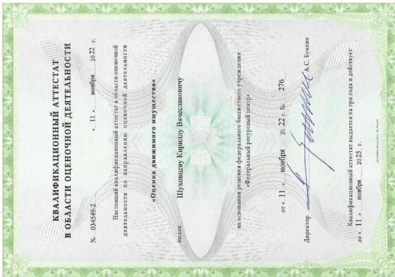
Квалификационный аттестат. Оценка движимого имущества