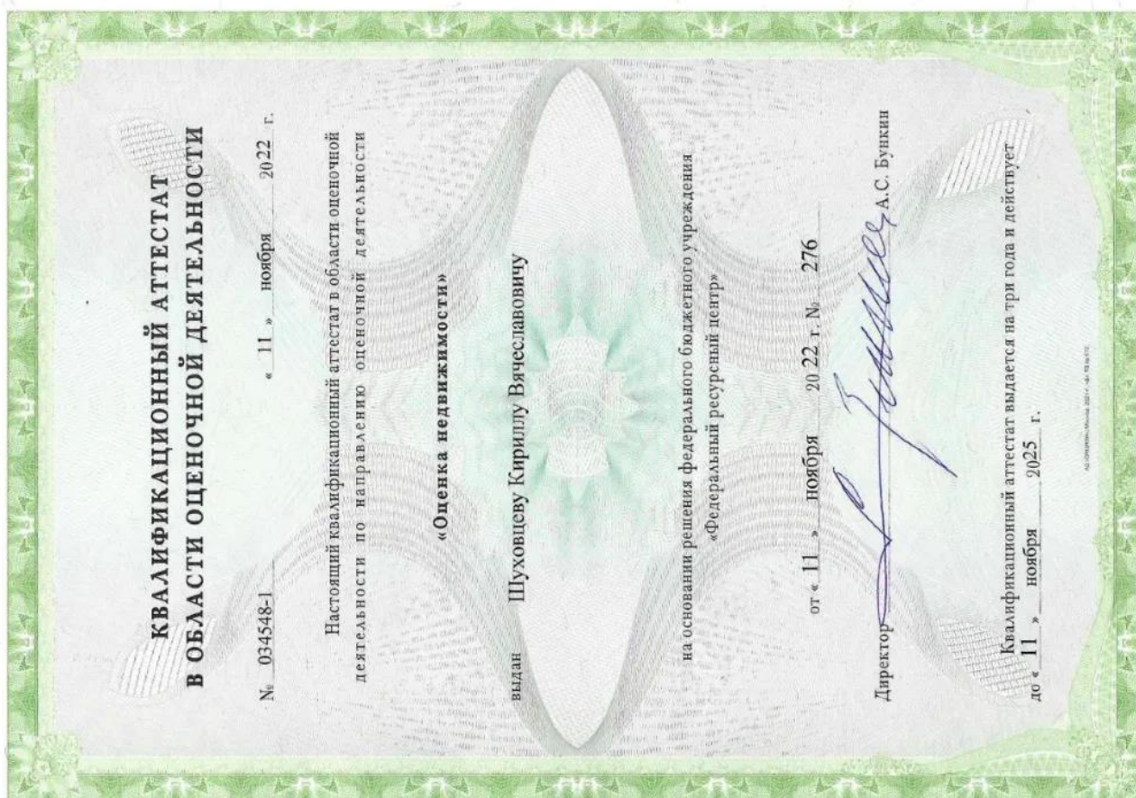
Квалификационный аттестат. Оценка недвижимости