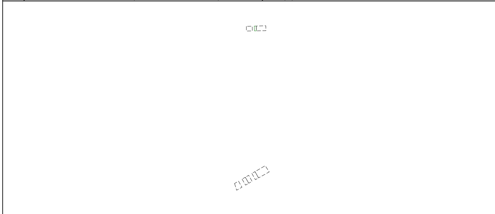
Схема расположения объекта недвижимости (части объекта недвижимости) на земельном участке(ах)