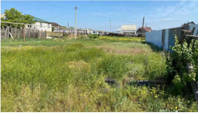
Фото №5. Общий вид