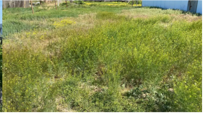
Фото №6. Общий вид