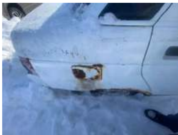
Фото №6. фото