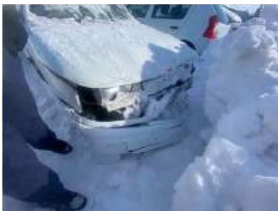
Фото №5. фото