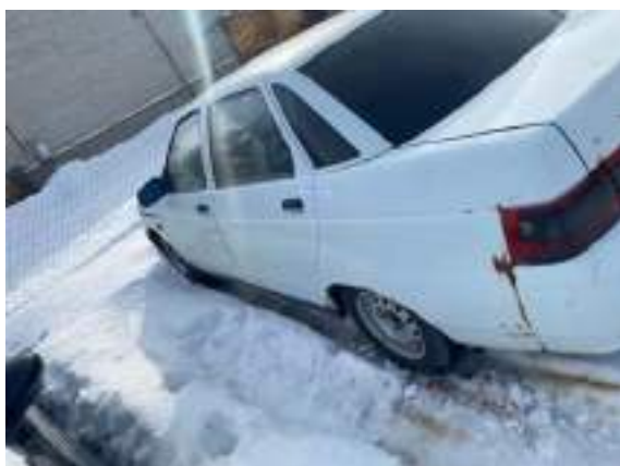
Фото №7. фото