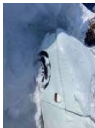
Фото №12. фото