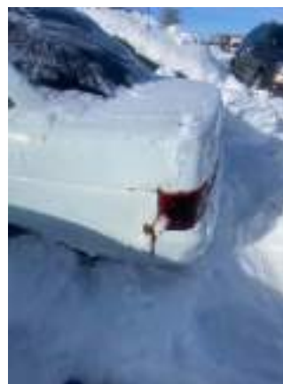
Фото №4. фото