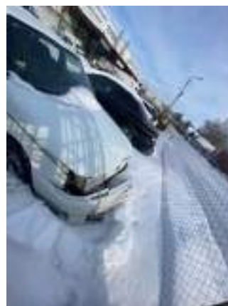
Фото №10. фото