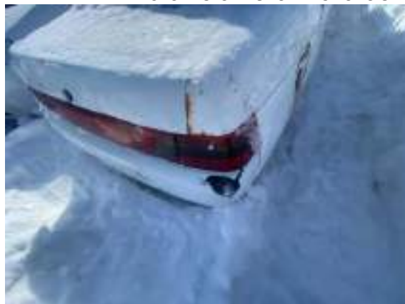
Фото №2. фото