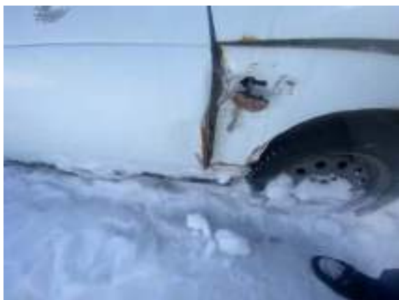
Фото №9. фото