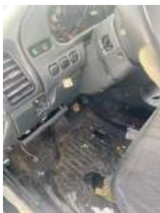
Фото №16. фото