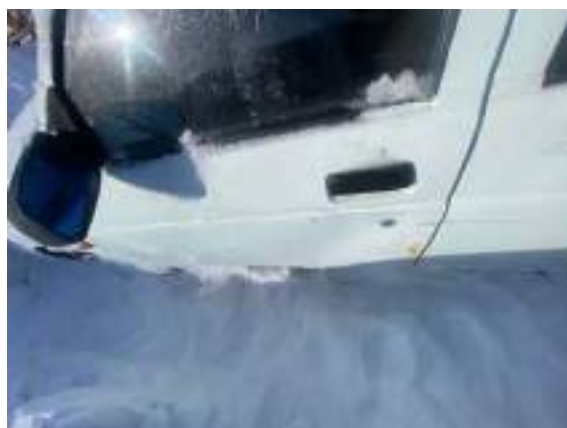
Фото №8. фото