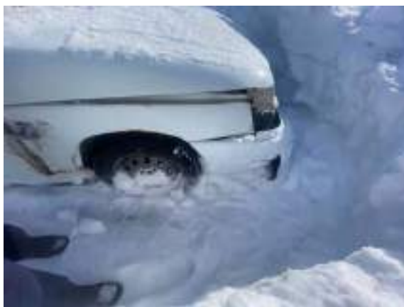
Фото №3. фото