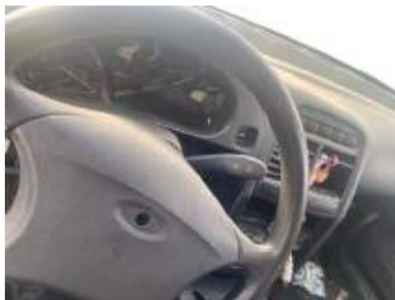
Фото №14. фото