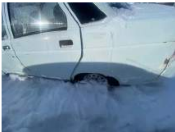
Фото №13. фото