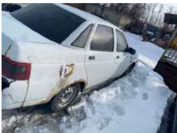
Фото №11. фото