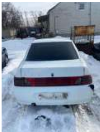
Фото №1. фото