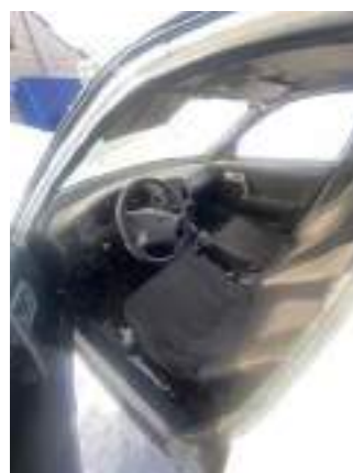
Фото №17. фото