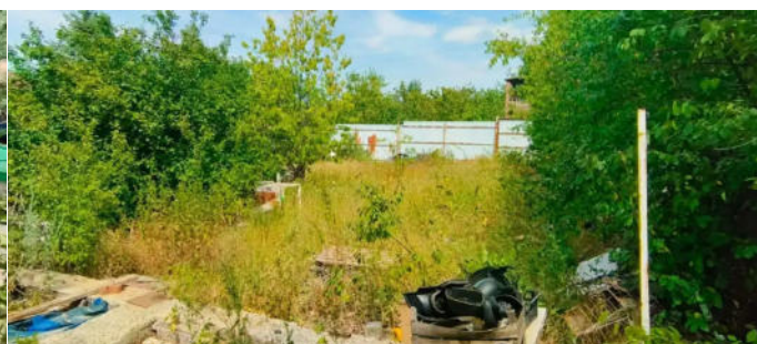
Фото №3. Общий вид