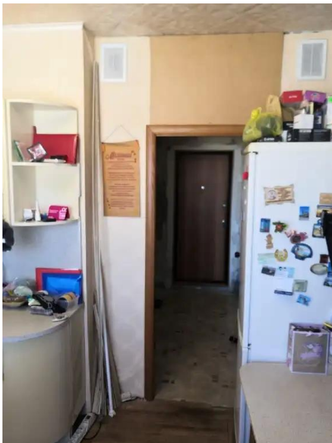
Фото №1. Общий квартиры