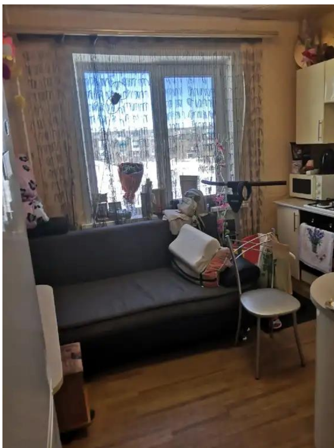
Фото №3. Общий квартиры