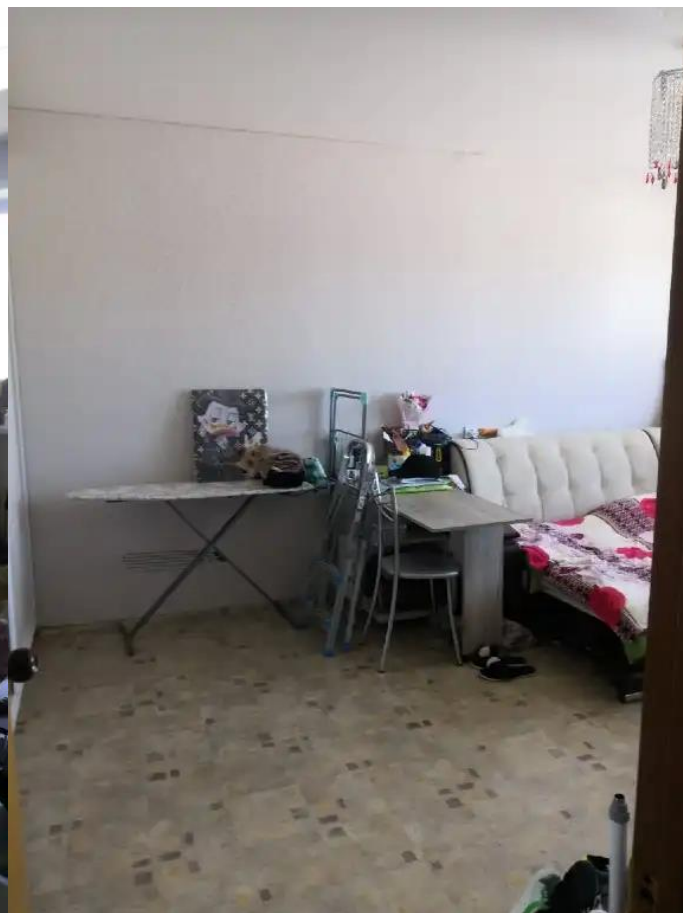
Фото №6. Общий квартиры