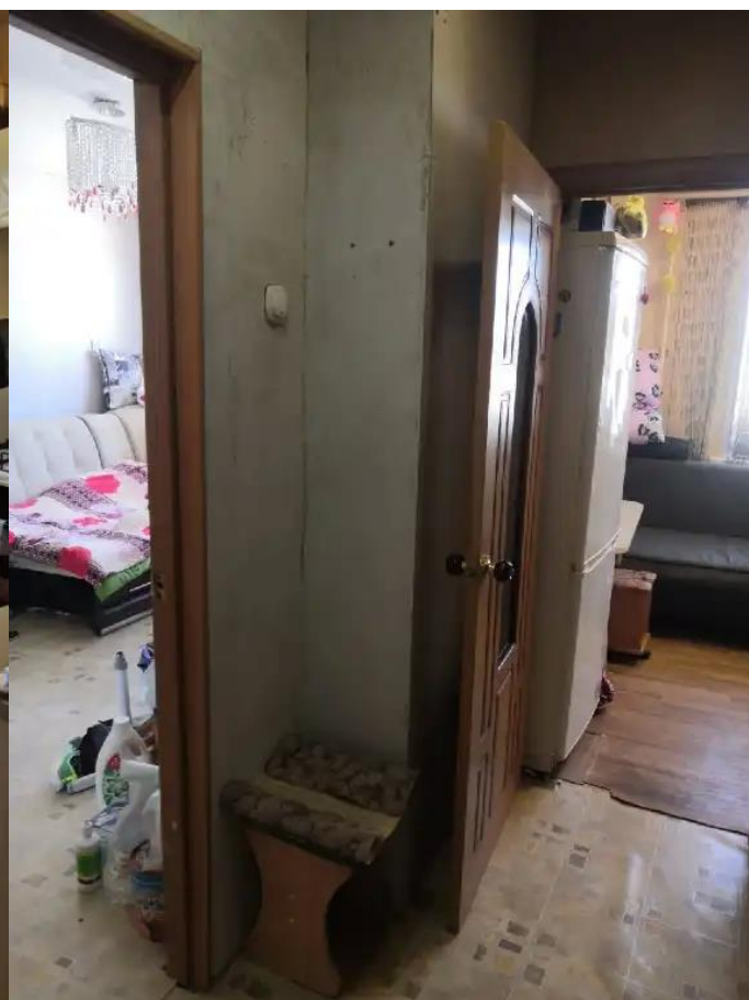
Фото №4. Общий квартиры