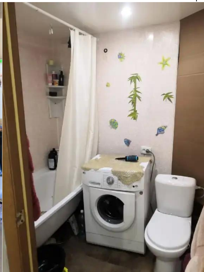
Фото №2. Общий квартиры