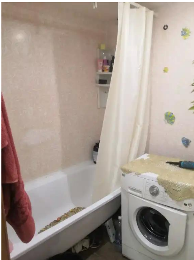
Фото №7. Общий квартиры