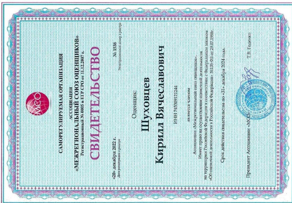
Свидетельство СРО оценщика