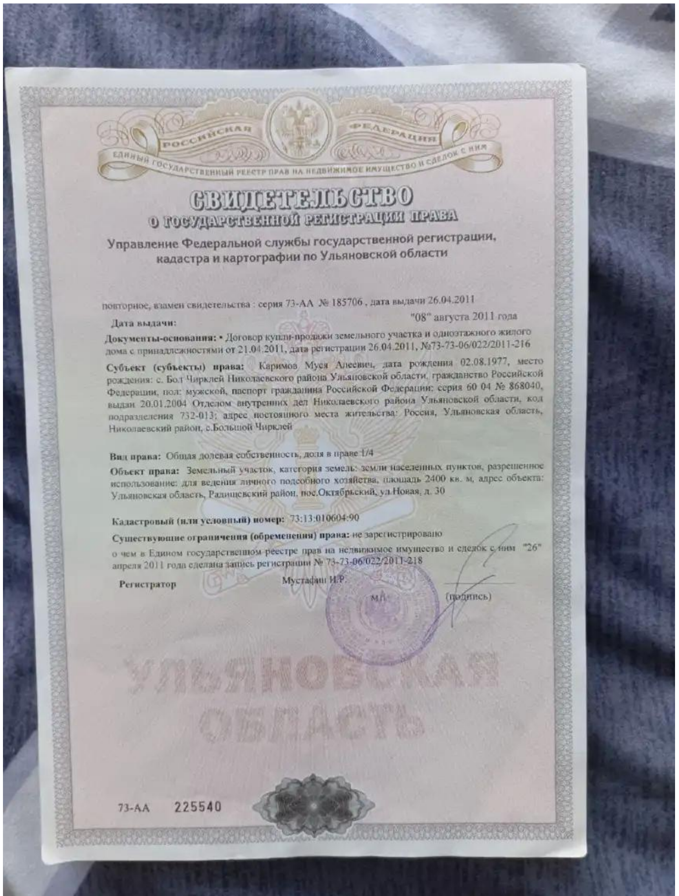
Свидетельство о государственной регистрации права