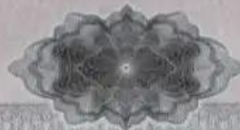
Свидетельство о государственной регистрации права