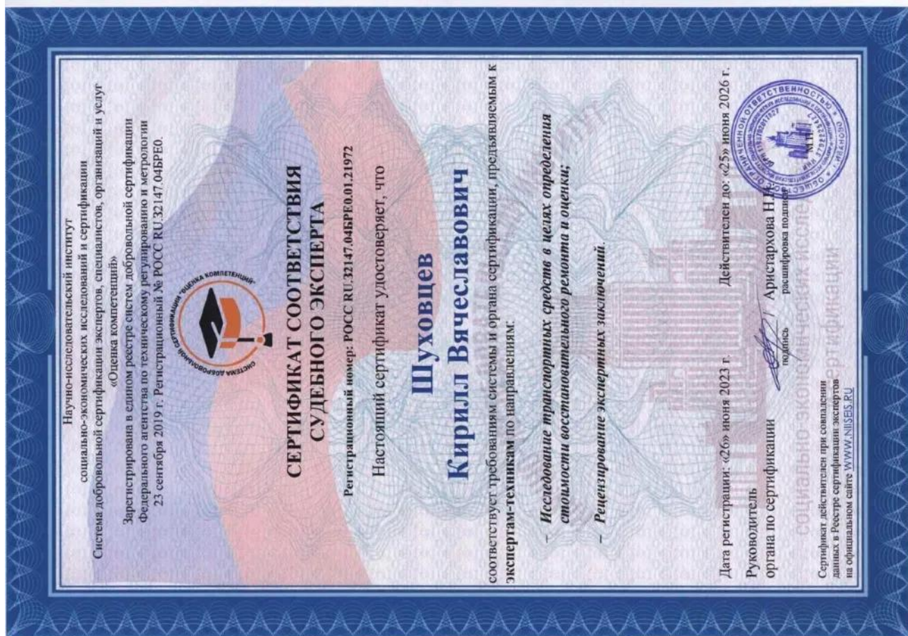
Сертификат соответствия судебного эксперта