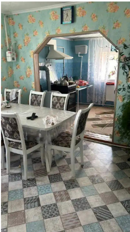
Фото №7. Общий вид