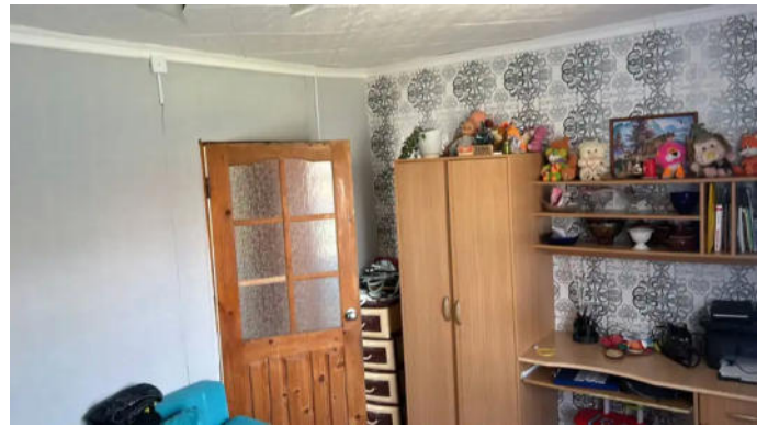
Фото №6. Общий вид