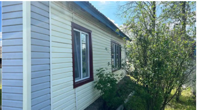
Фото №12. Общий вид