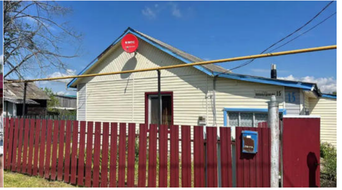
Фото №14. Общий вид