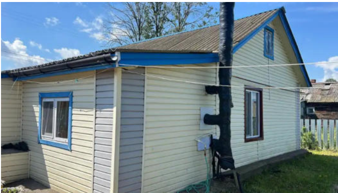
Фото №11. Общий вид