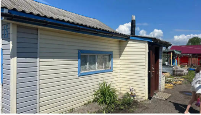
Фото №13. Общий вид