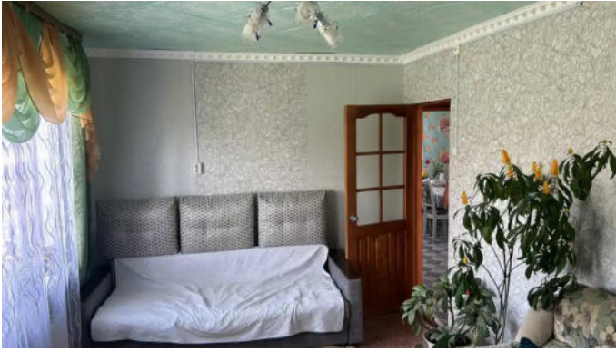
Фото №9. Общий вид