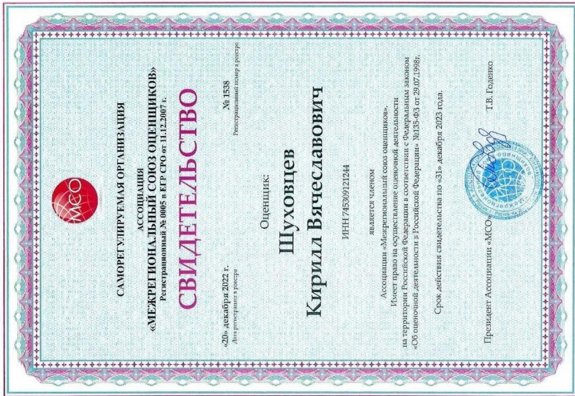
Свидетельство СРО оценщика