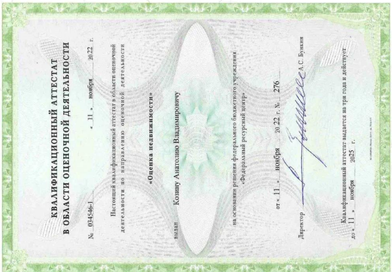
Квалификационный аттестат "Оценка недвижимости"