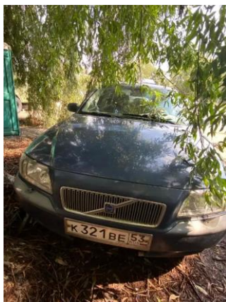
Фото №7. Общий вид