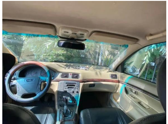
Фото №6. Общий вид