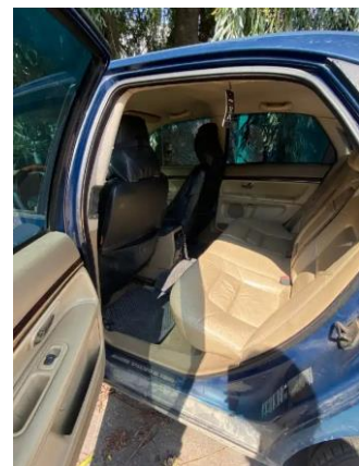
Фото №8. Общий вид