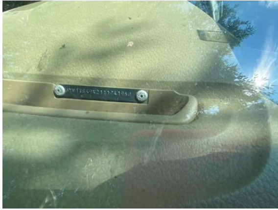
Фото №9. VIN