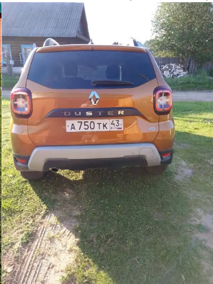
Фото №2. WhatsApp Image 2024-06-21 at 13