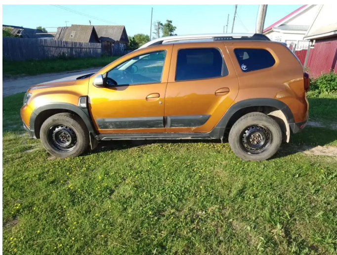
Фото №3. WhatsApp Image 2024-06-21 at 13