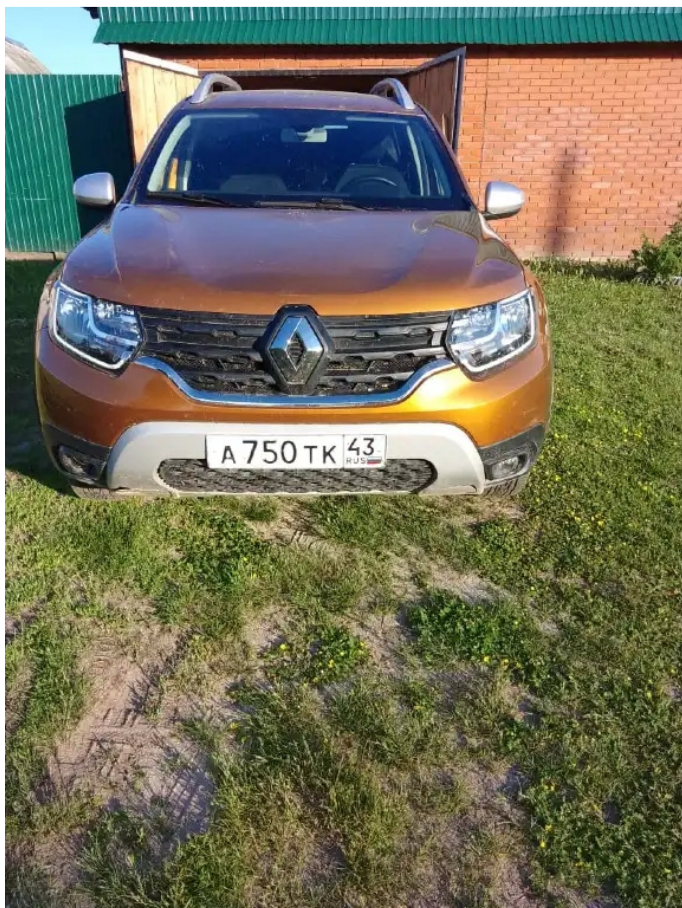
Фото №1. WhatsApp Image 2024-06-21 at 13