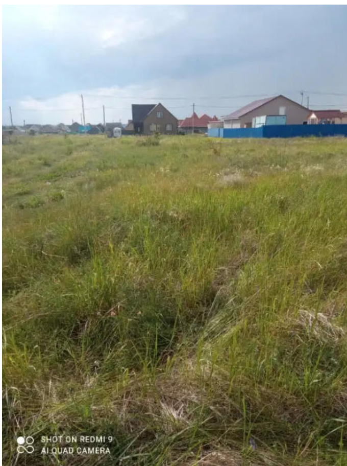
Фото №3. photo1719235895 (2)