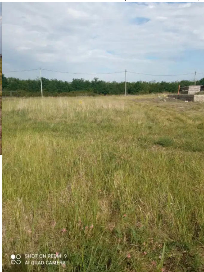
Фото №2. photo1719235895 (1)