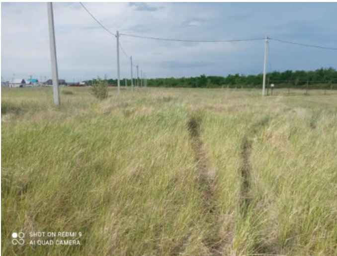
Фото №5. photo1719235895