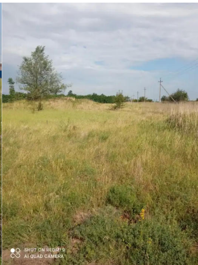
Фото №4. photo1719235895 (3)