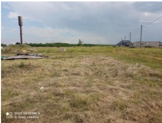
Фото №1. photo1719235759