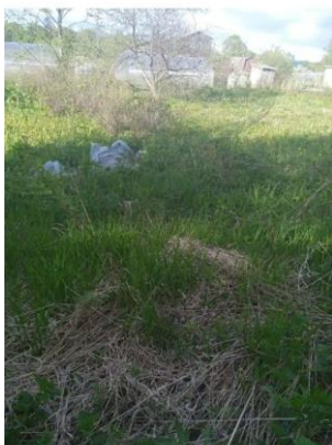
Фото №7. Общий вид