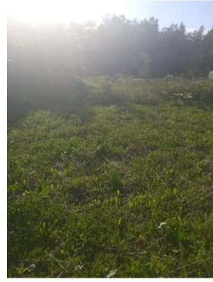
Фото №10. Общий вид