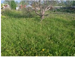
Фото №1. Общий вид