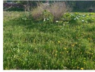
Фото №2. Общий вид