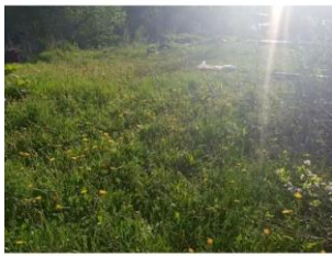
Фото №3. Общий вид