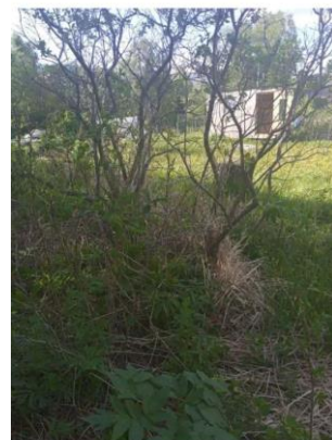
Фото №8. Общий вид