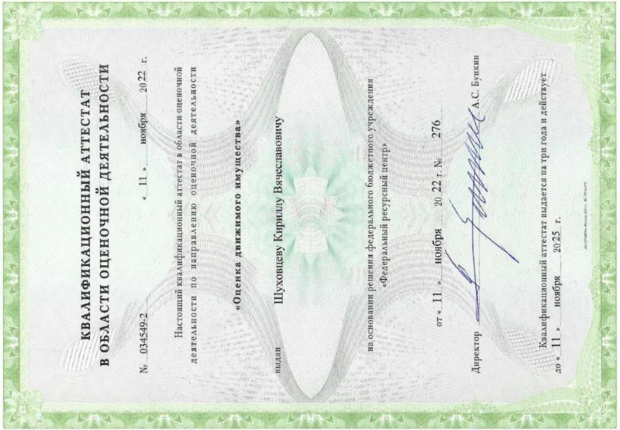
Квалификационный аттестат. Оценка движимого имущества