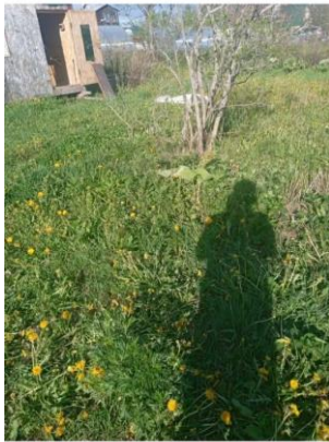
Фото №5. Общий вид