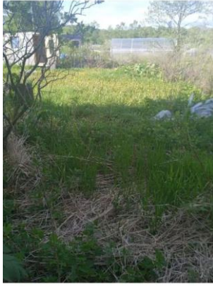
Фото №9. Общий вид