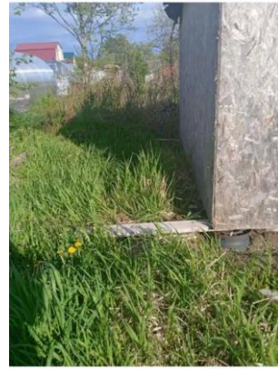
Фото №4. Общий вид