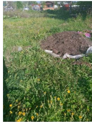
Фото №6. Общий вид