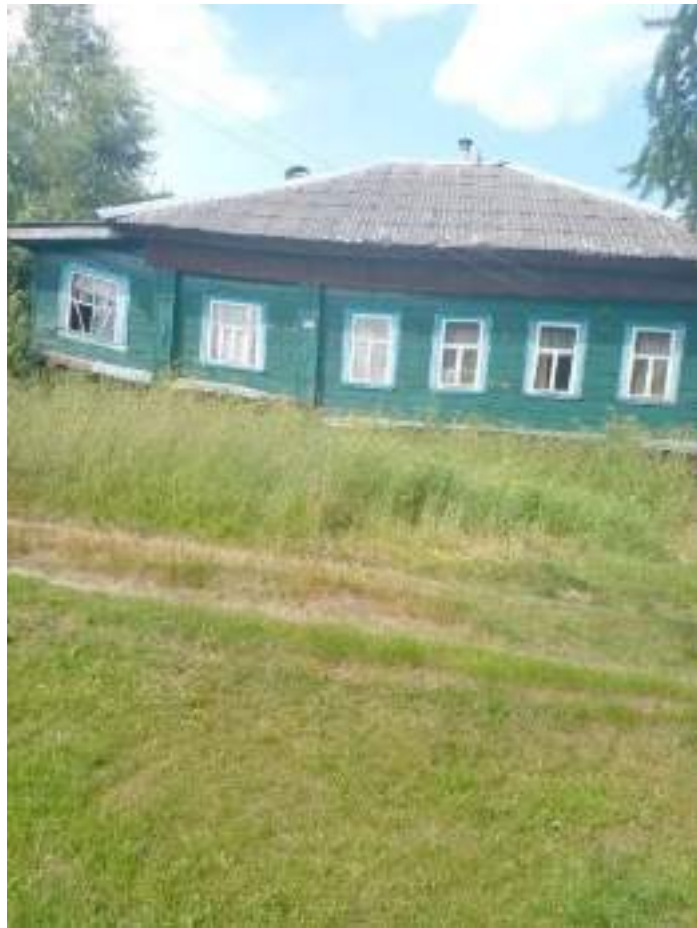
Фото №1. Общий вид