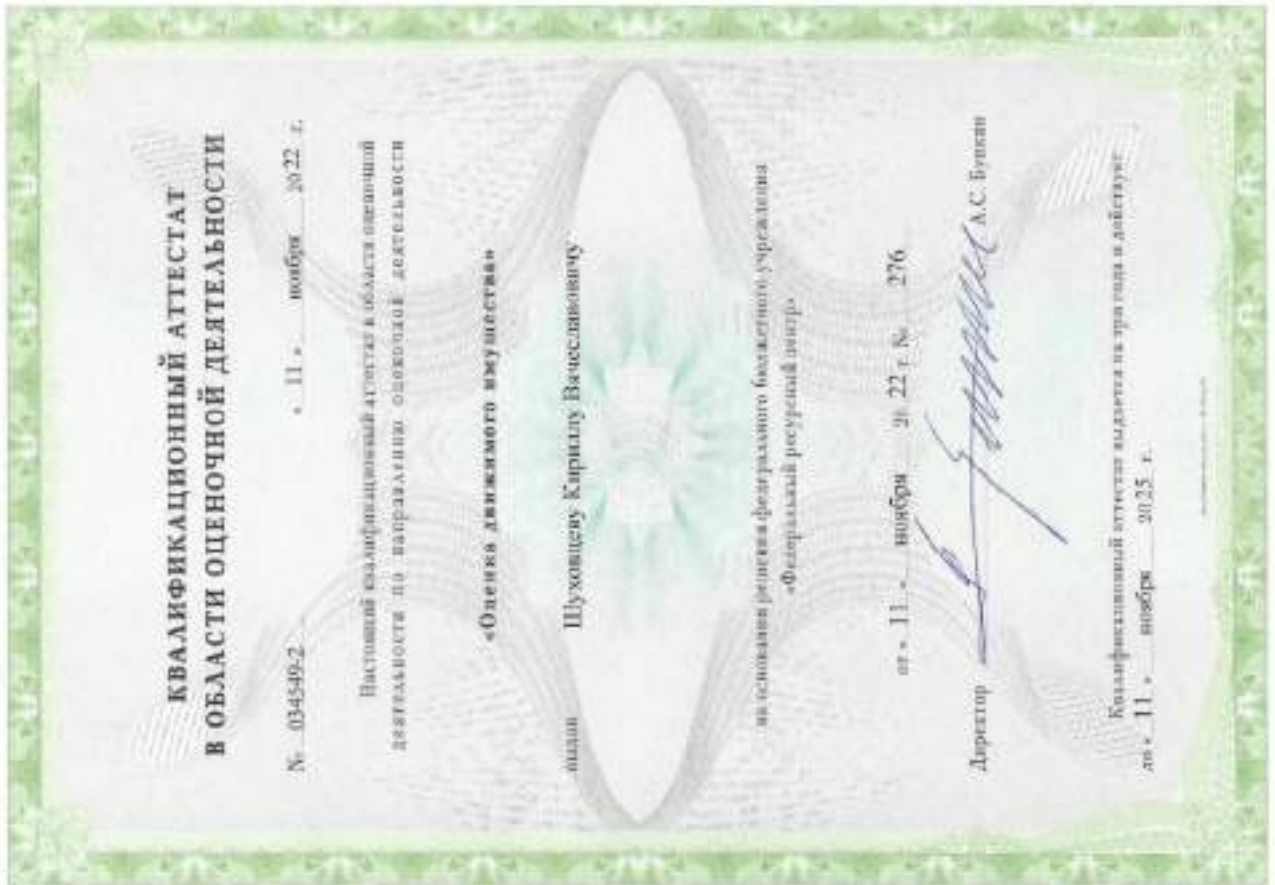
Квалификационный аттестат. Оценка движимого имущества