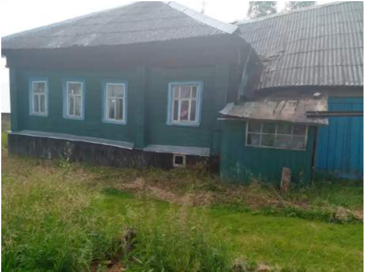
Фото №2. Общий вид