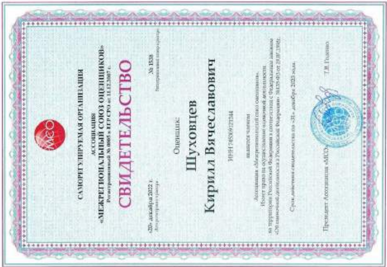
Свидетельство СРО оценщика