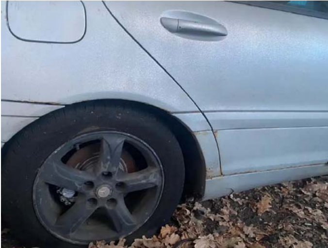
Фото №1. 1dbf7434-013b-43fb-b2c8-4150f8a86a54