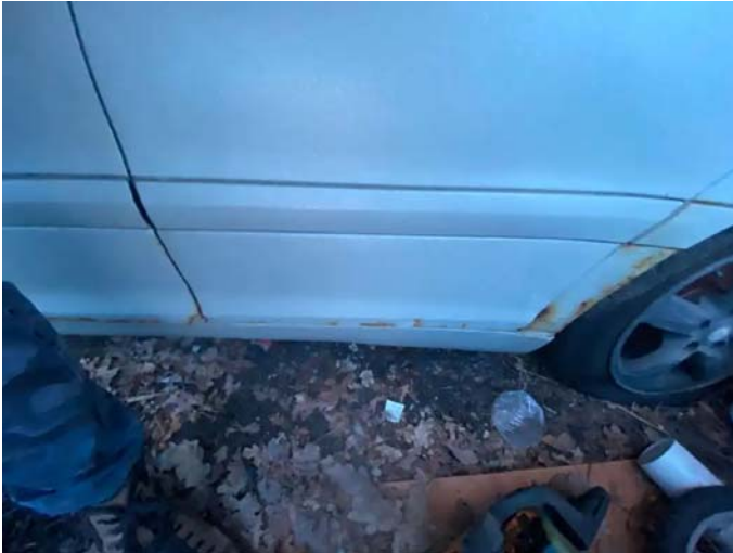
Фото №3. 4966c05f-c7d5-4d8f-856c-168b8c3493dd