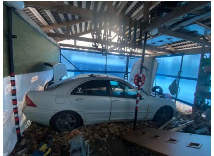
Фото №6. 945d9b57-c1ac-4f82-92f2-d1e7ac0fa46c