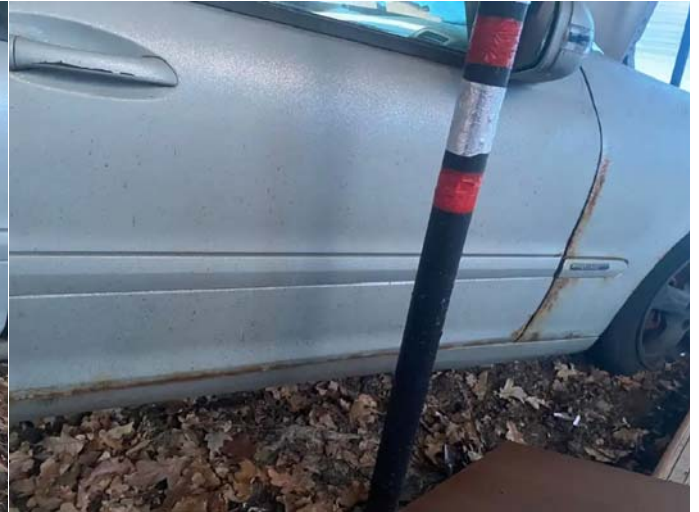
Фото №2. 2d714ba9-3571-45ca-a532-f8f65051646d