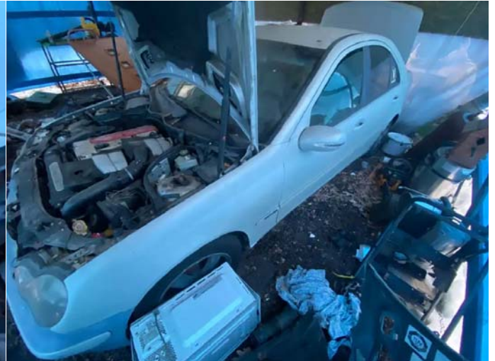
Фото №4. 63dc55b1-277e-4e24-a0d6-2caf0e05c3e9