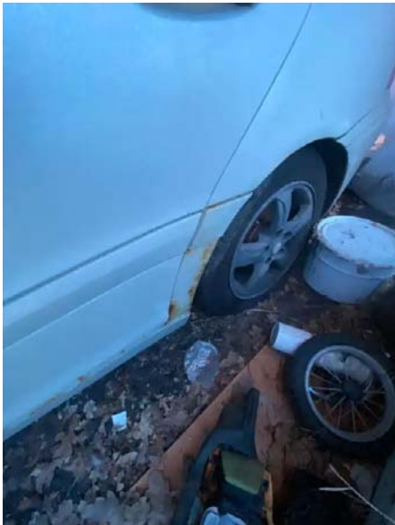
Фото №5. 6520b520-83a2-4af6-9338-974c97fdc925