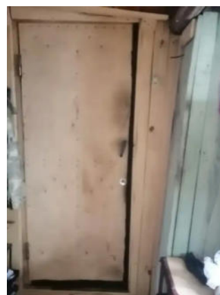
Фото №11. Общий вид