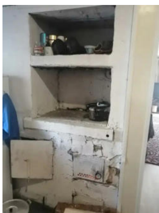
Фото №14. Общий вид