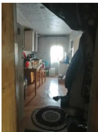
Фото №10. Общий вид