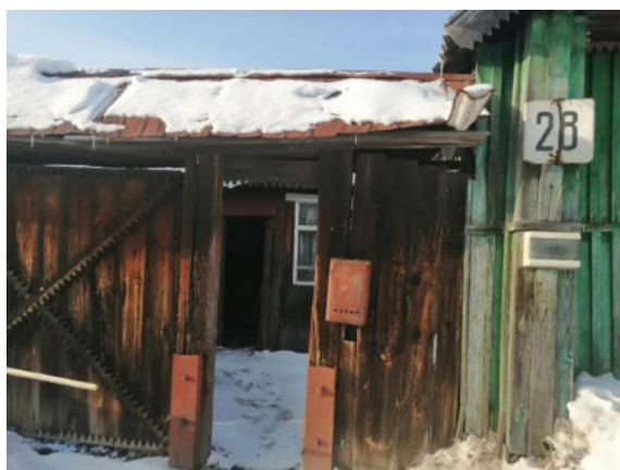
Фото №12. Общий вид