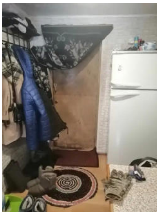
Фото №8. Общий вид