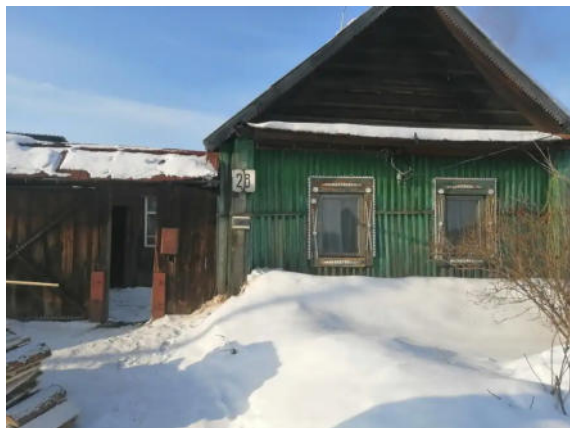
Фото №1. Общий вид