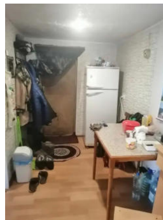
Фото №9. Общий вид