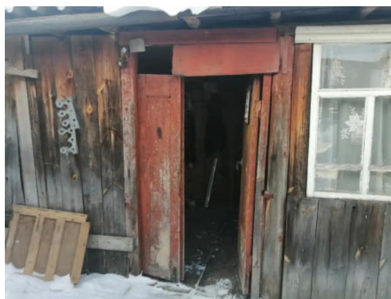
Фото №13. Общий вид