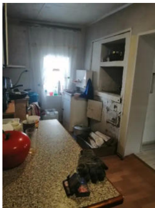
Фото №6. Общий вид