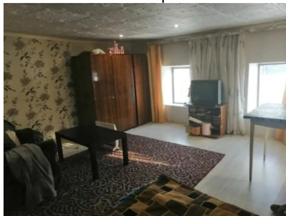
Фото №5. Общий вид