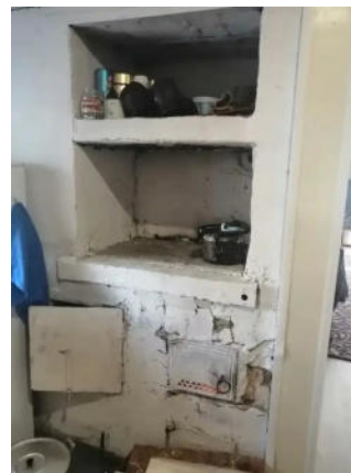
Фото №7. Общий вид