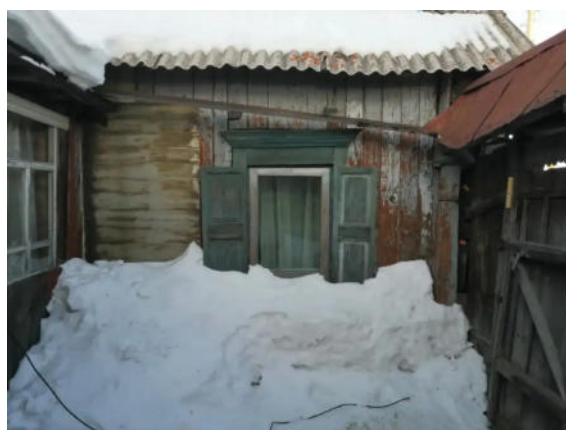
Фото №15. Общий вид