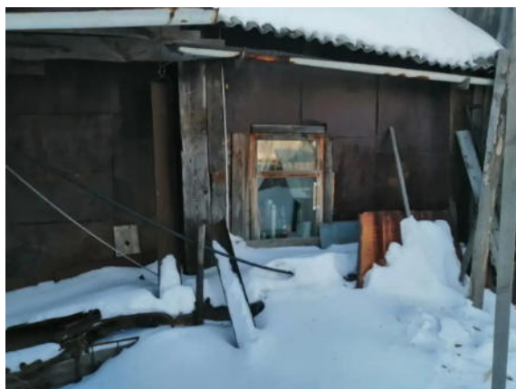
Фото №16. WhatsApp Image 2023-02-06 at 18