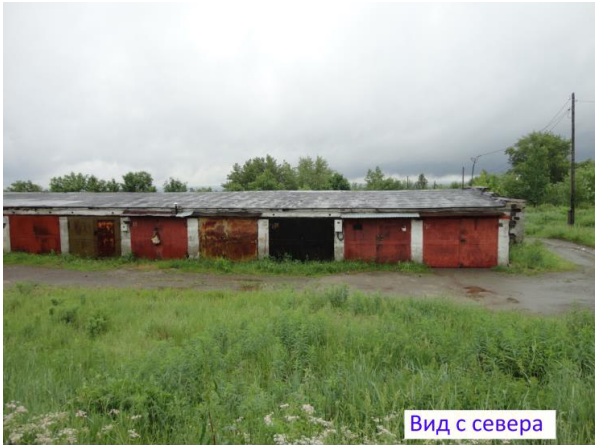
Вид с севера