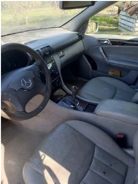
Фото №1. 0343ad79-b577-457e-beee-fc0ee4b5ca4b