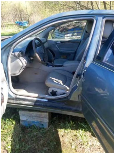
Фото №9. cc0a9f60-dac9-4c37-91d6-de8308892606