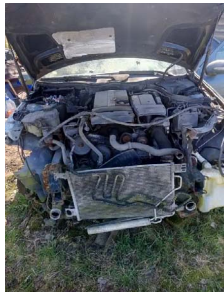
Фото №12. e96875b9-3b65-443f-aec0-15190a9ff8c2