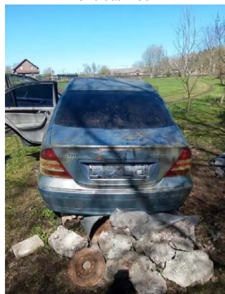
Фото №14. f6f3a569-996e-47b6-9132-692d673d0c73