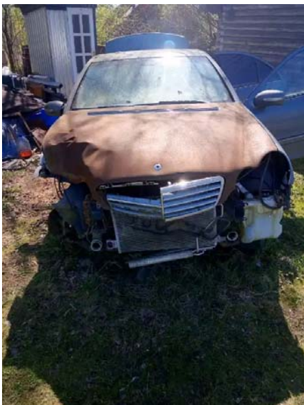
Фото №11. dfa043ed-858c-4c9a-8880-0fdc04cbc59e