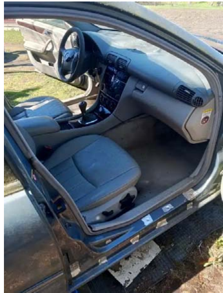
Фото №2. 1996dd2-d15e-4ddb-a72f-b7211e3f4ad6