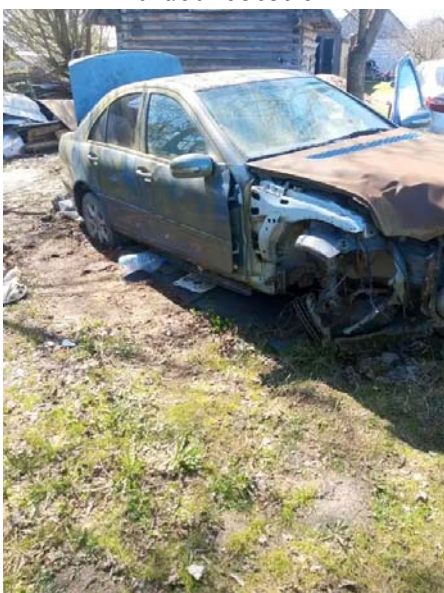
Фото №13. ef5f694c-f404-43b4-8166-1359ccd6fb13