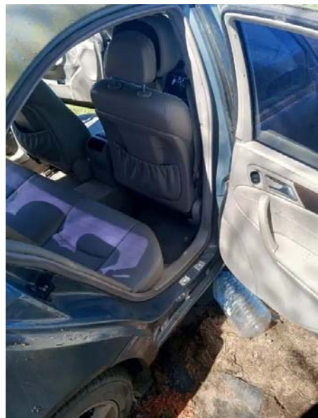
Фото №4. 40ce4841-3e10-4a6c-9720-8f879306f74d