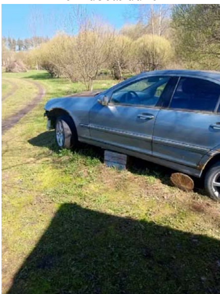
Фото №5. 54120c1e-1405-43c6-9236-c2d1a7860525