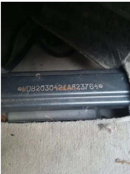
Фото №3. 3b6a0c83-c2cf-4b8d-8f87-642d86a9dd46