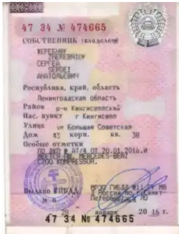
СТС Мерседес Бенс 2л