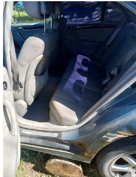
Фото №10. da9d0ad9-7fae-4d50-8af6-19de6b69130f