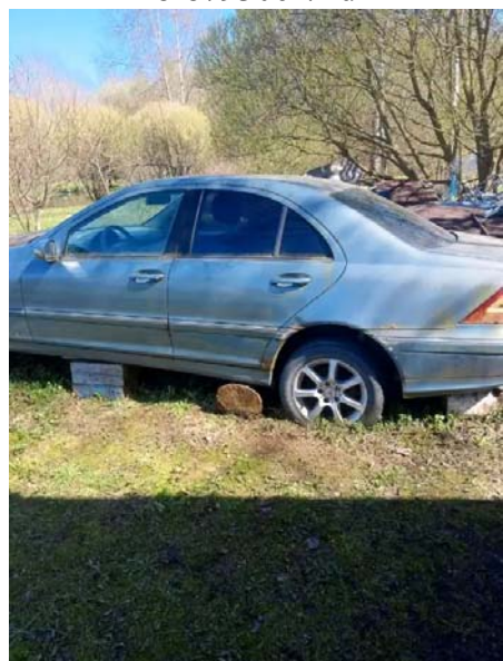
Фото №6. 7181119a-d4fc-46de-ae8e-86860312a747