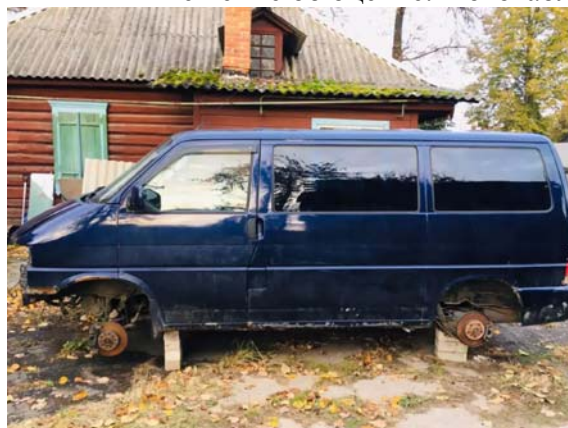
Фото №2. фото ТС