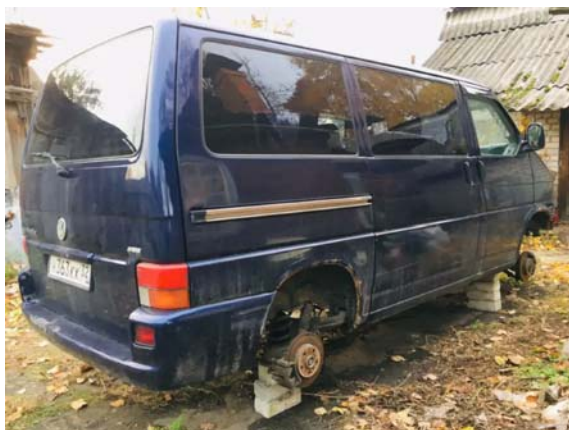
Фото №5. фото ТС