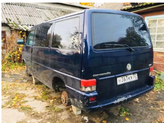
Фото №3.