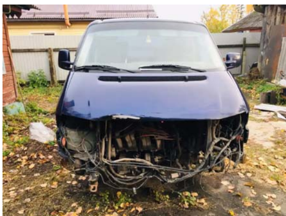
Фото №7. фото ТС