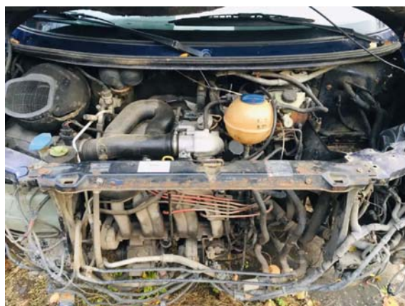
Фото №8. фото ТС