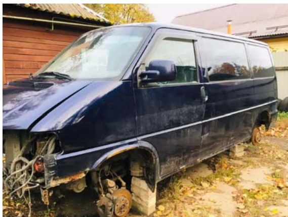
Фото №1. фото ТС