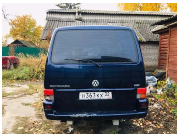
Фото №4. фото ТС