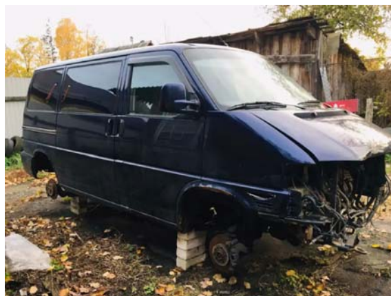
Фото №6.