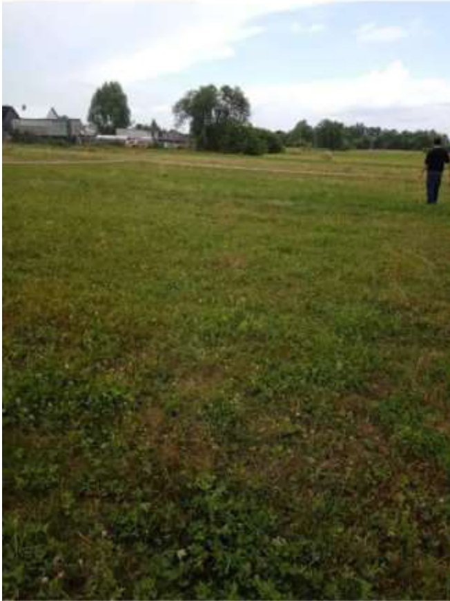
Фото №1. Общий вид участка