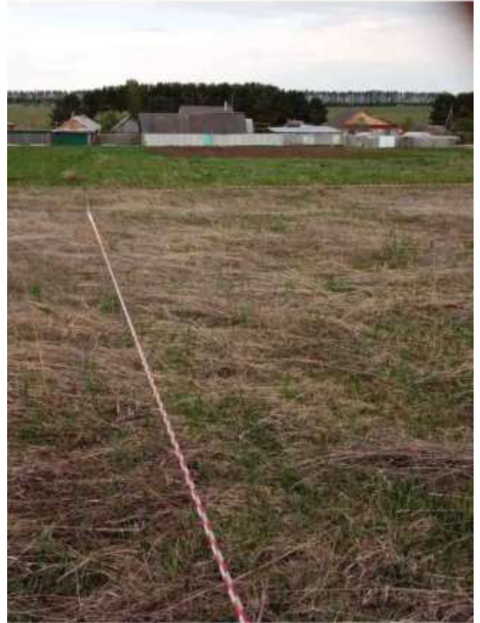
Фото №2. Общий вид участка

Публичная кадастровая карта России на 25.01.2024