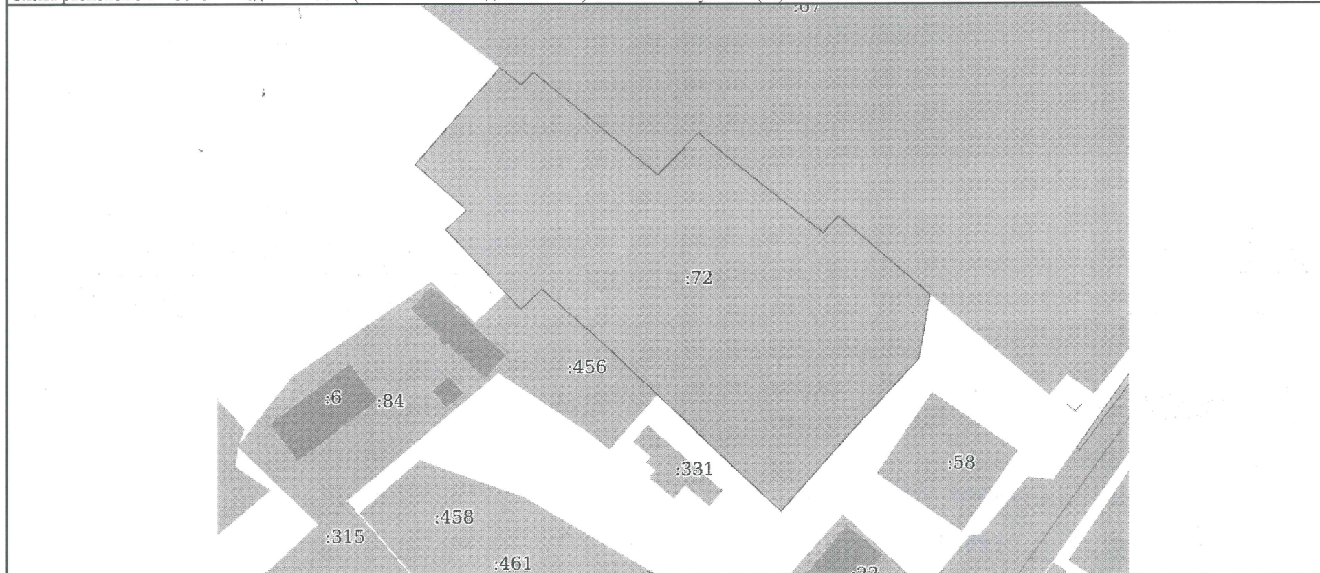
Схема расположения объекта недвижимости (части объекта недвижимости) на земельном участке(ах)