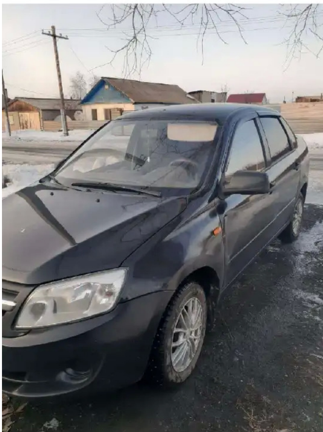
Фото №3. ПТС СТС Фото