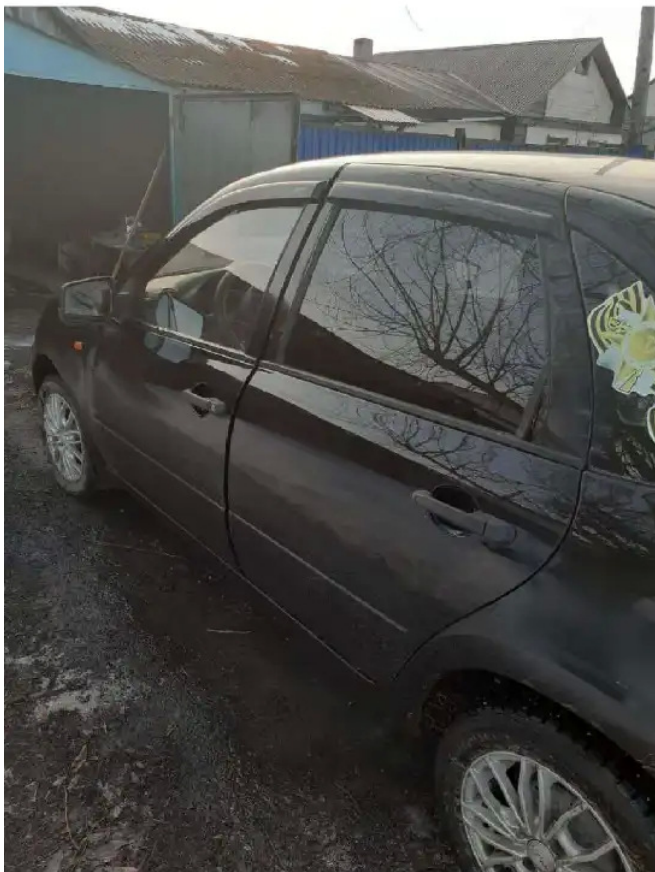
Фото №1. ПТС СТС Фото