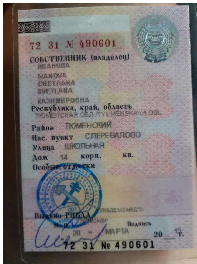
ПТС СТС Фото