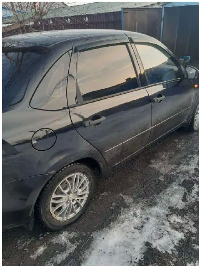
Фото №2. ПТС СТС Фото