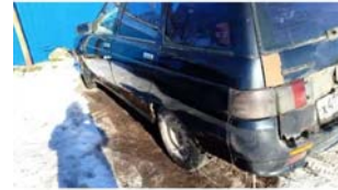
Φοτο №18. φωτο