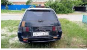
Фото №24. Фото ТС