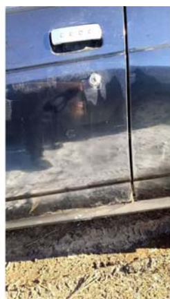
Фото №11. фото