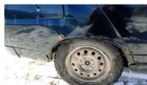
Фото №14. фото