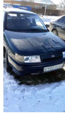
Φοτο №16. φωτο