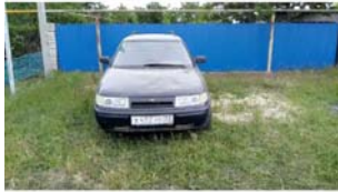
Фото №26.