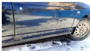
Фото №2. фото