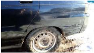
Φοτο №17. φωτο