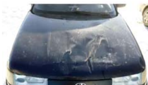
Φοτο №22. φωτο