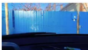
Фото №4. фото