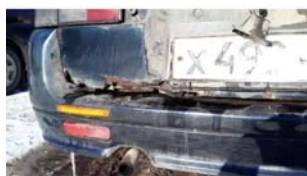
Фото №13. фото