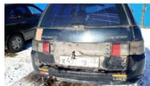
Фото №3. фото