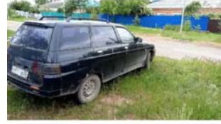
Фото №25.