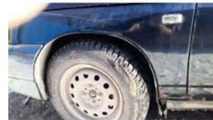
Φοτο №21. φωτο