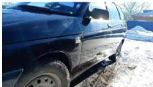
Φοτο №19. φωτο