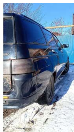
Фото №12. фото