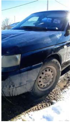
Φοτο №15. φωτο