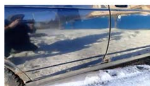
Фото №8. фото