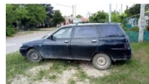
Φοτο №23. Φοτο TC