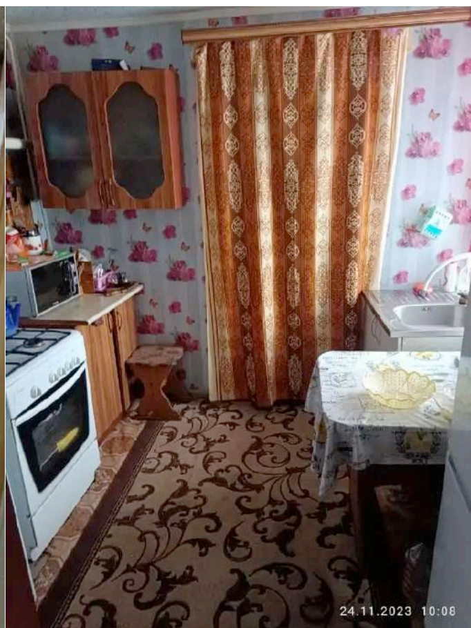
Фото №4. Общий вид