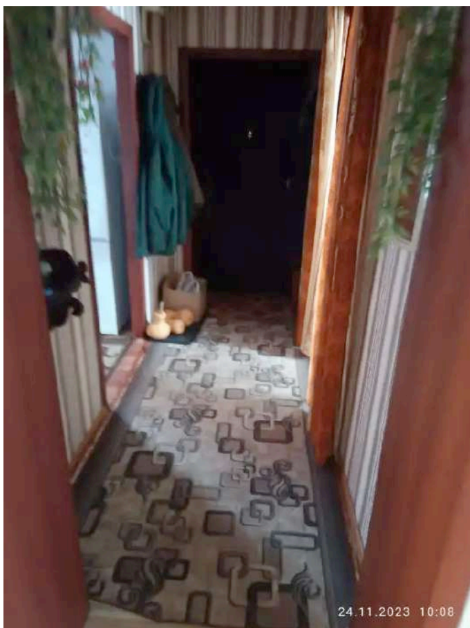
Фото №1. Общий вид