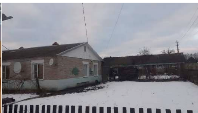
Фото №6. Общий вид