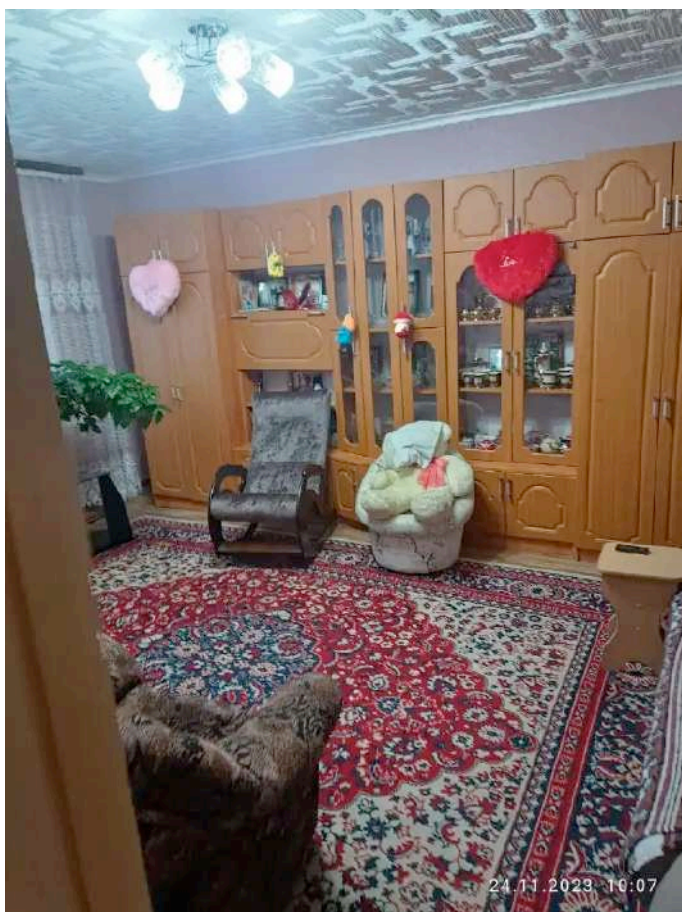
Фото №5. Общий вид