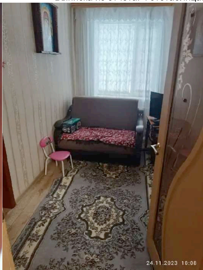
Фото №2. Общий вид