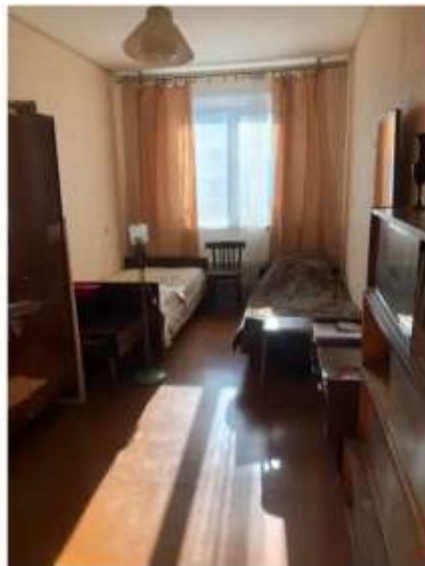
Фото №2. Комната