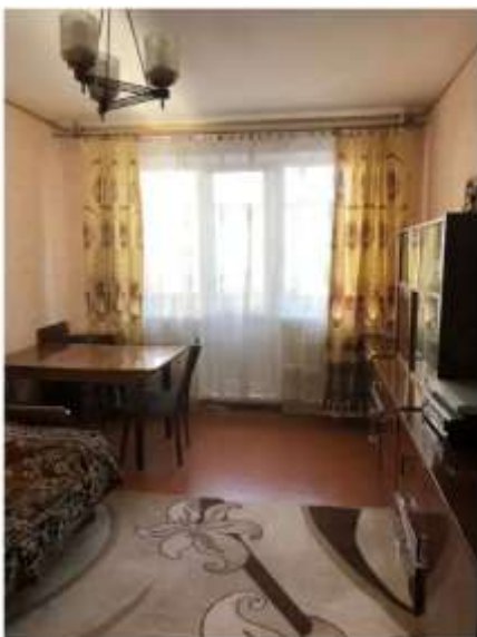
Фото №3. Комната