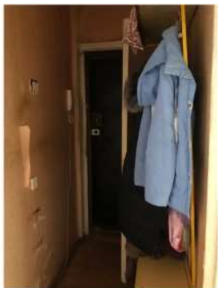
Фото №5. Коридор