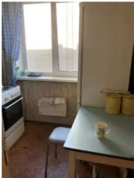
Фото №1. Кухня

Выписка из отчета №2902243601. Фототаблица