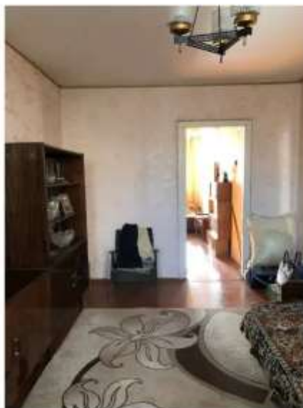
Фото №4. Комната