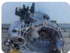
Контрактная МКПП Fiat