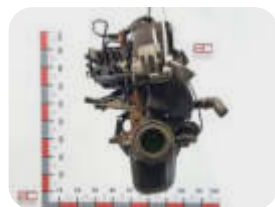
Двигатель (ДВС) Fiat Punto 2 (188) 31 040 ₽