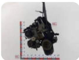
Двигатель (ДВС) Fiat Punto 2 (188) 31 040 ₽