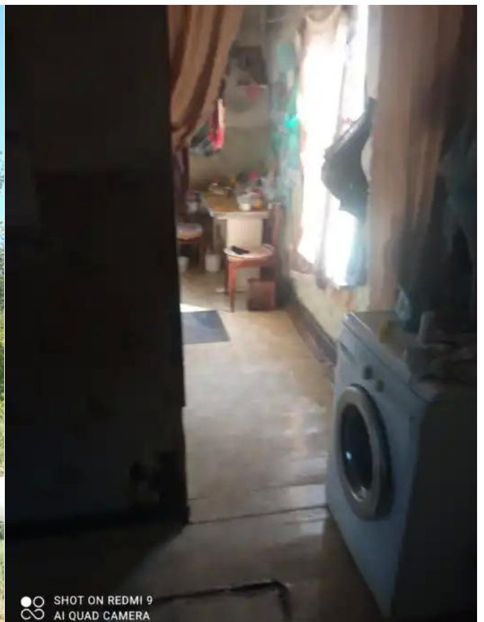
Фото №4. Общий вид