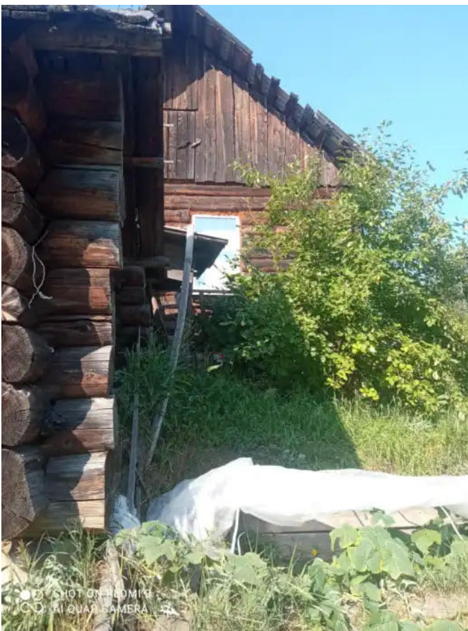
Фото №3. Общий вид