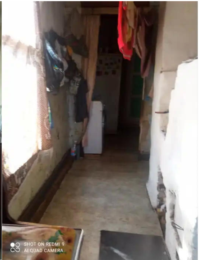
Фото №6. Общий вид