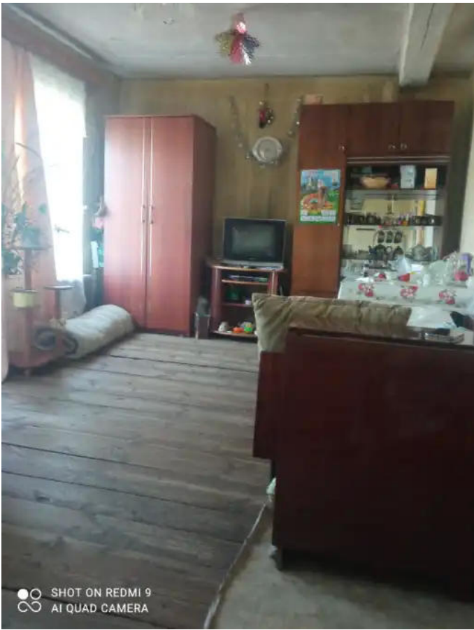
Фото №5. Общий вид