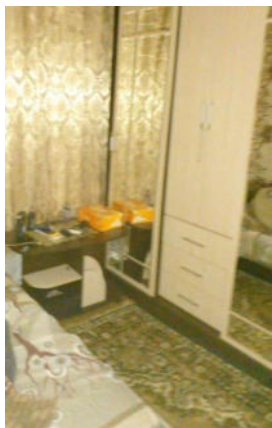
Фото №1. Общий вид