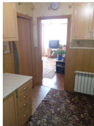
Фото №2. Общий вид