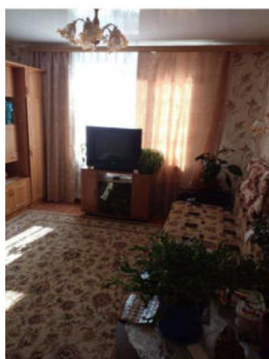
Фото №4. Общий вид