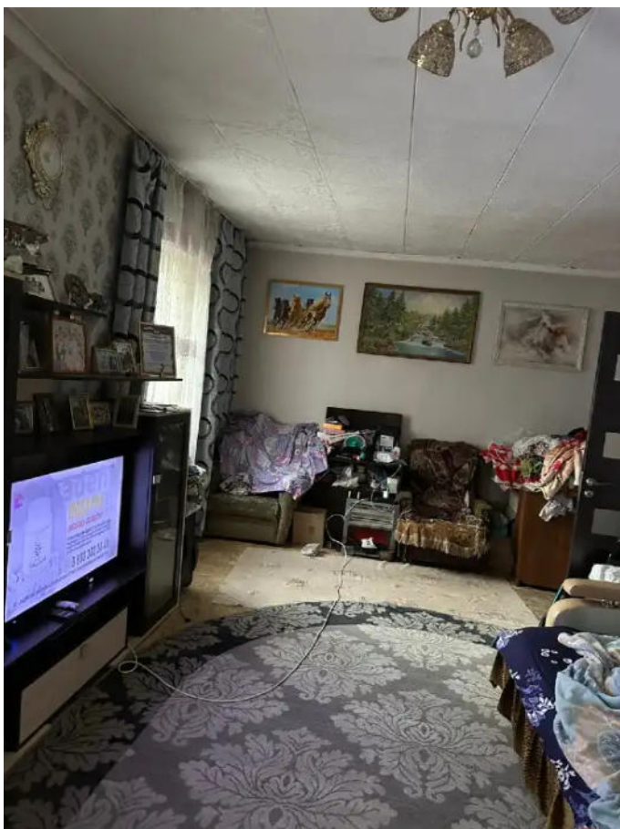
Фото №11. Общий вид