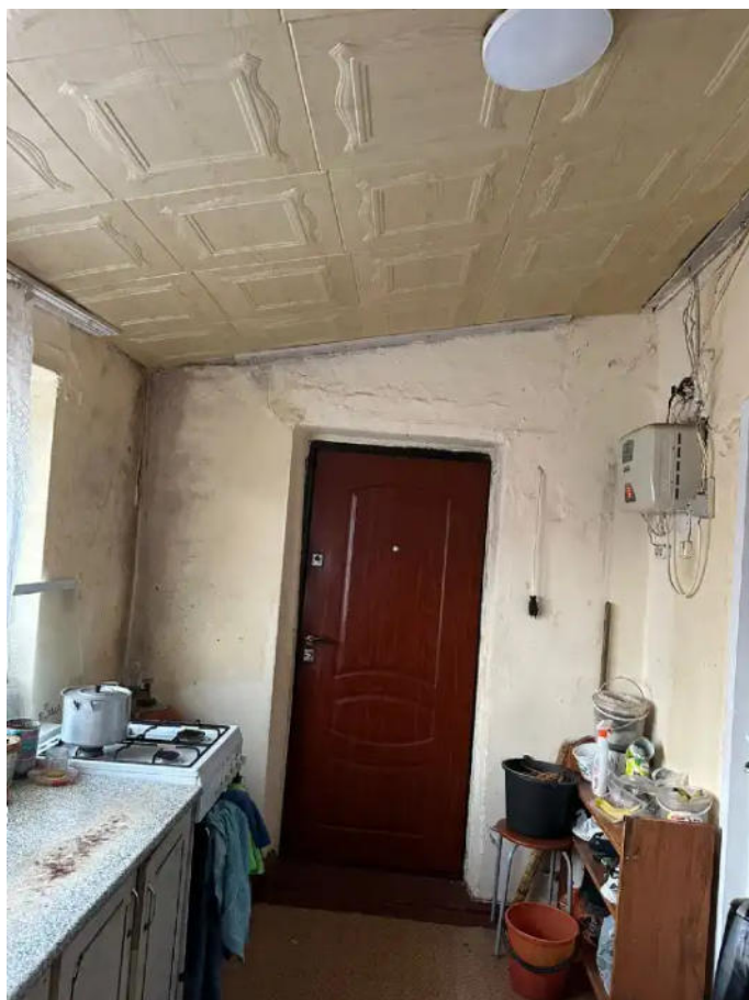
Фото №13. Общий вид