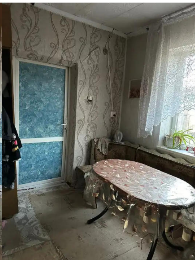
Фото №4. Общий вид