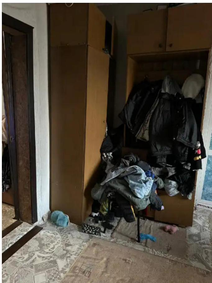
Фото №3. Общий вид