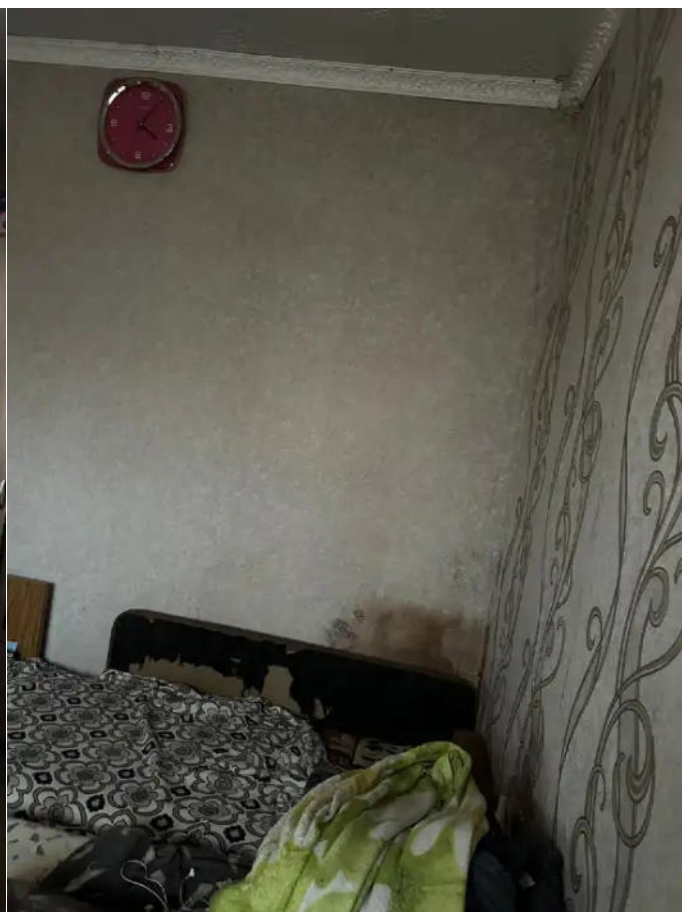
Фото №8. Общий вид