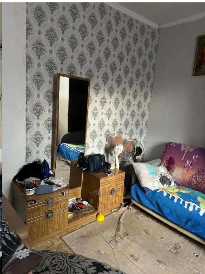
Фото №6. Общий вид