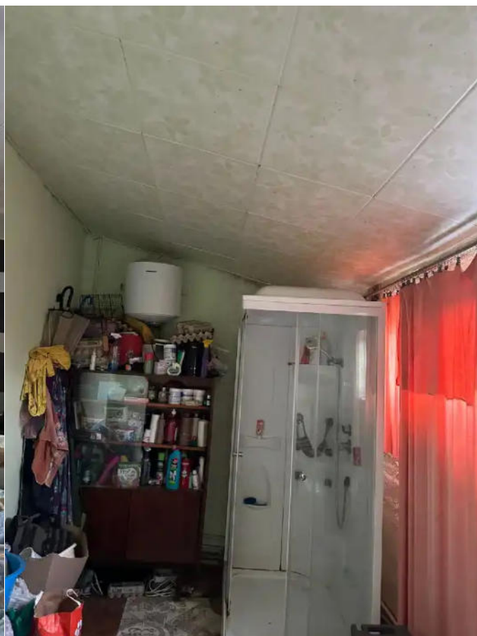
Фото №12. Общий вид