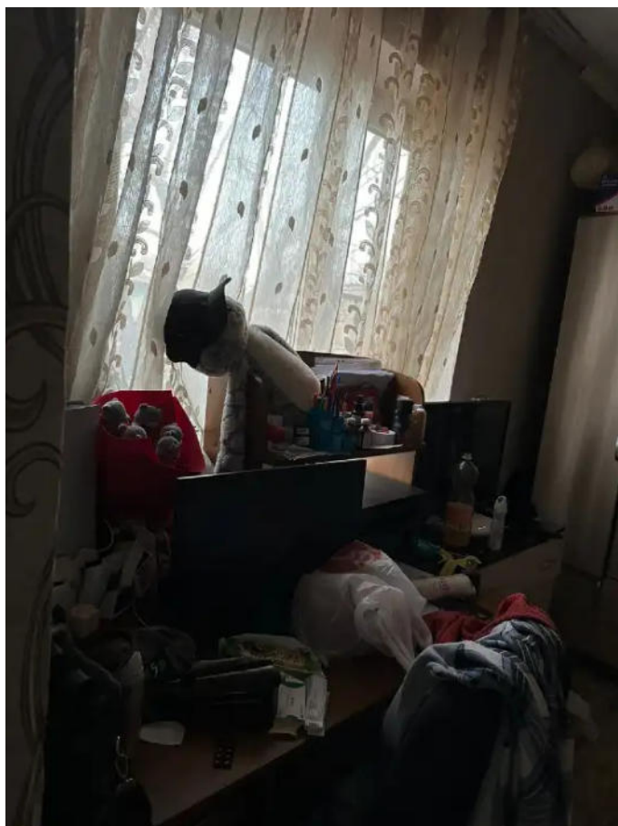
Фото №7. Общий вид