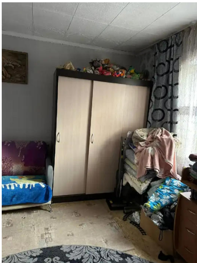
Фото №15. Общий вид