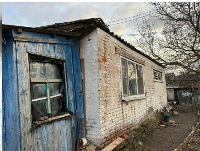
Фото №16. Общий вид