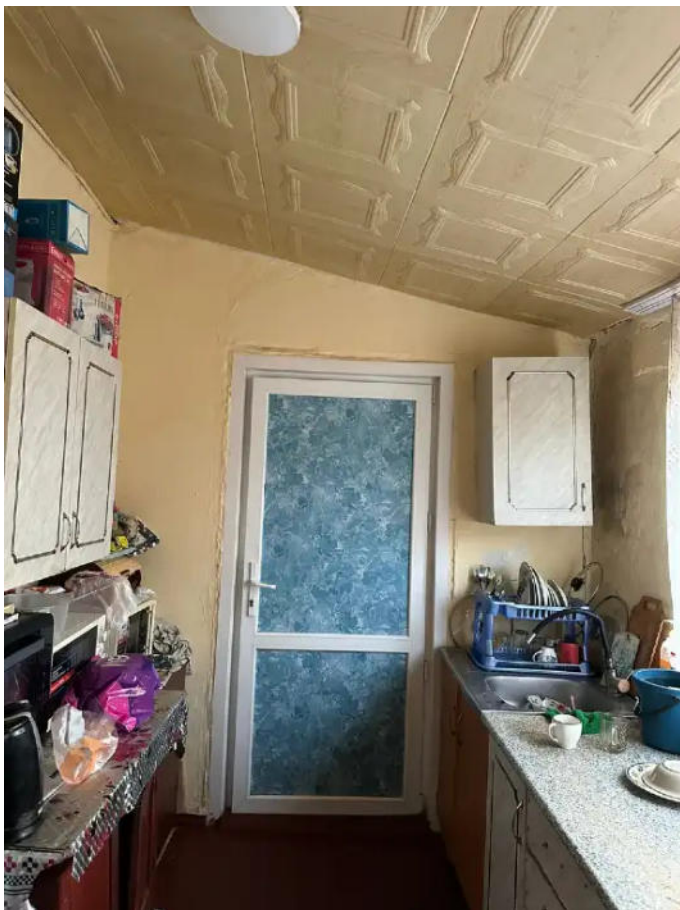
Фото №9. Общий вид