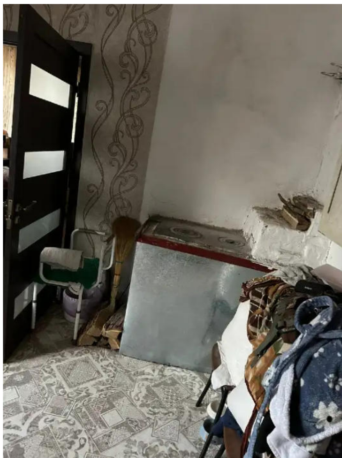
Фото №5. Общий вид