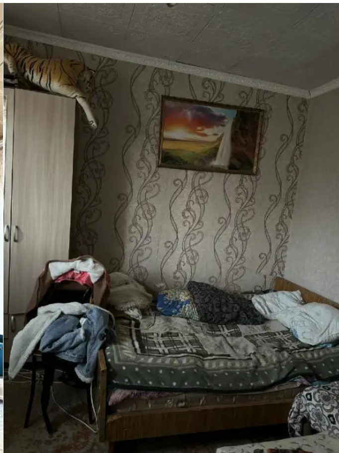
Фото №10. Общий вид