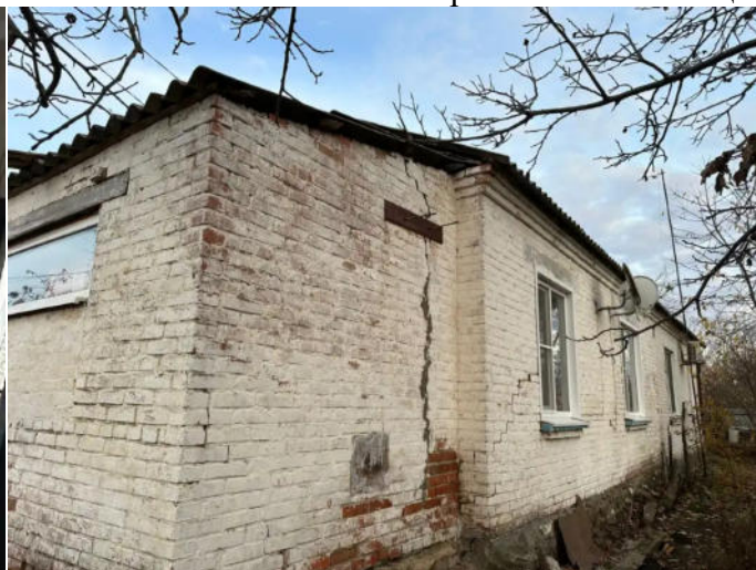
Фото №2. Общий вид