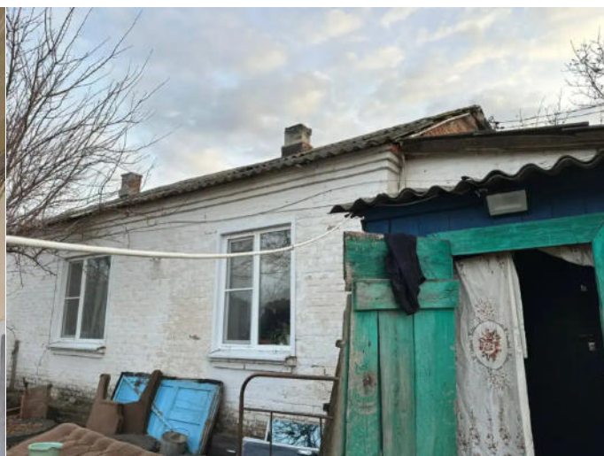
Фото №14. Общий вид