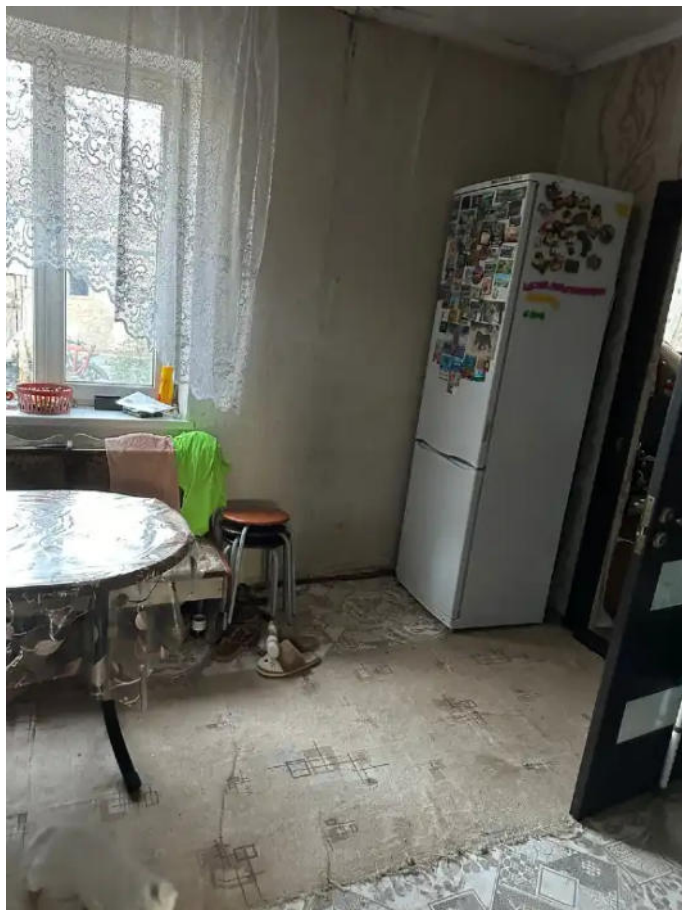
Фото №1. Общий вид