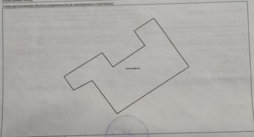
Схема расположения объекта недвижимости на земельном(ых) участке(х)