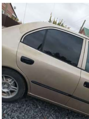
Фото №3.