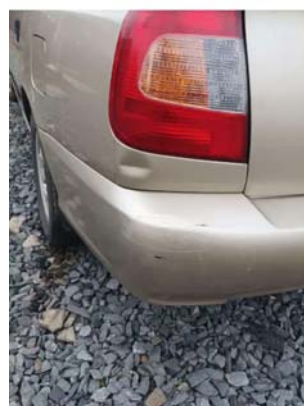
Фото №5. Фото ТС