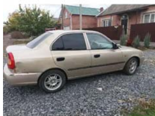
Фото №10.