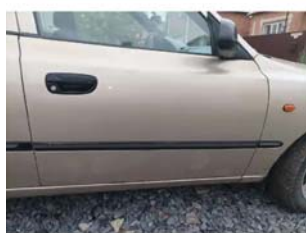
Фото №7. Фото ТС