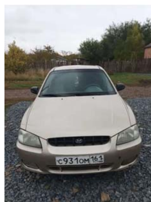
Фото №9. Фото ТС