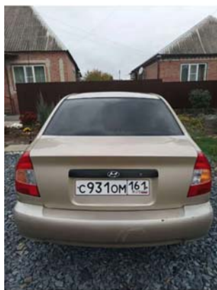
Фото №1. Фото ТС