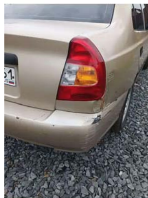
Фото №2.