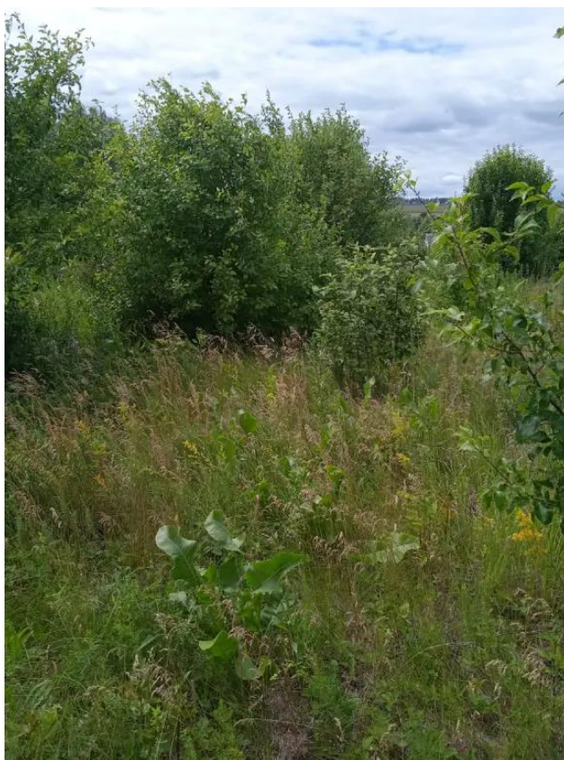
Фото №14. WhatsApp Image 2025-07-10 at 12