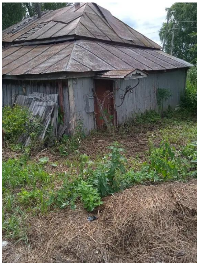
Фото №13. WhatsApp Image 2025-07-10 at 12