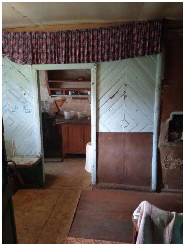
Фото №5. WhatsApp Image 2025-07-10 at 12