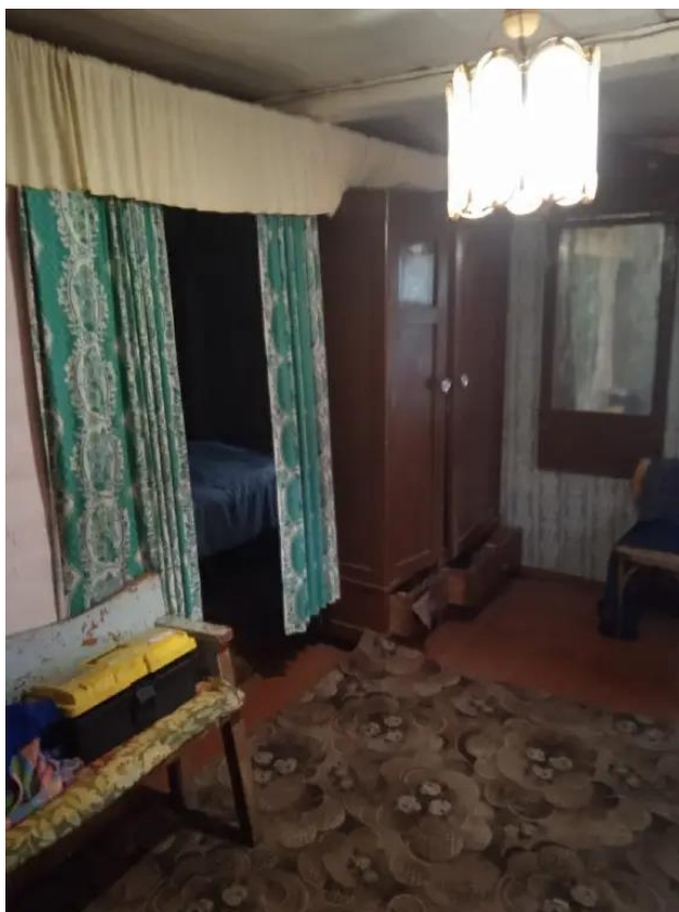
Фото №6. WhatsApp Image 2025-07-10 at 12