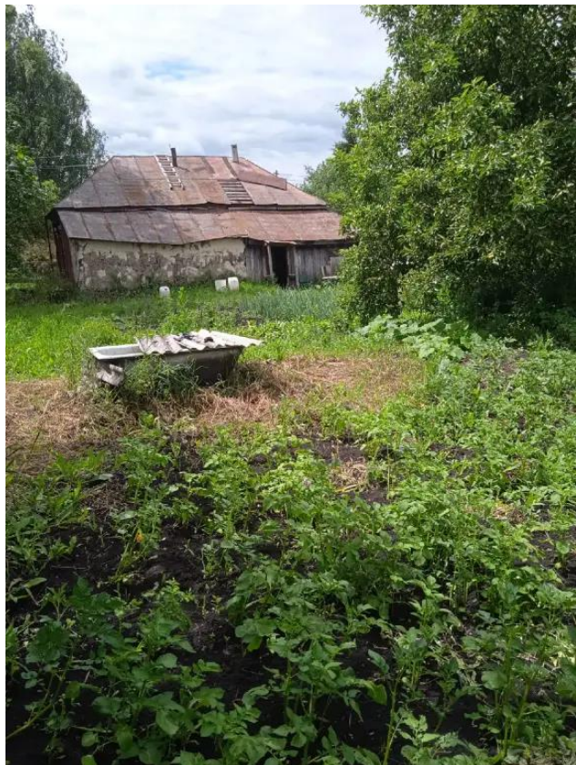
Фото №1. WhatsApp Image 2025-07-10 at 12