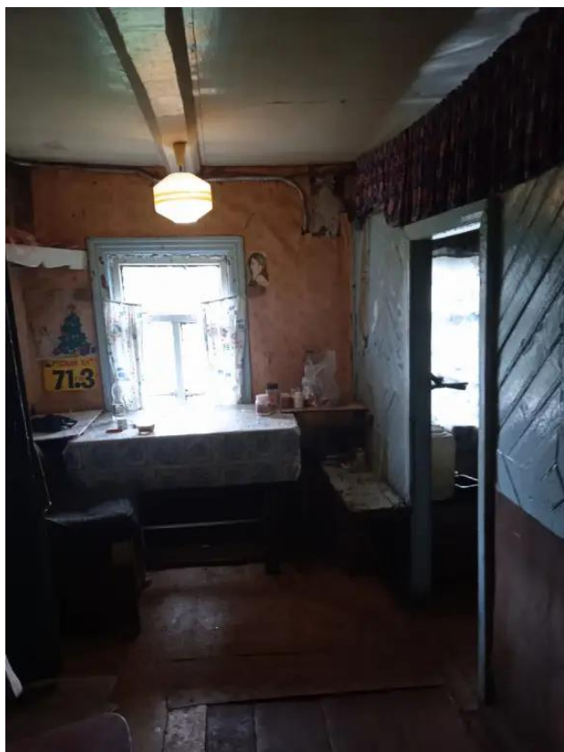
Фото №9. WhatsApp Image 2025-07-10 at 12