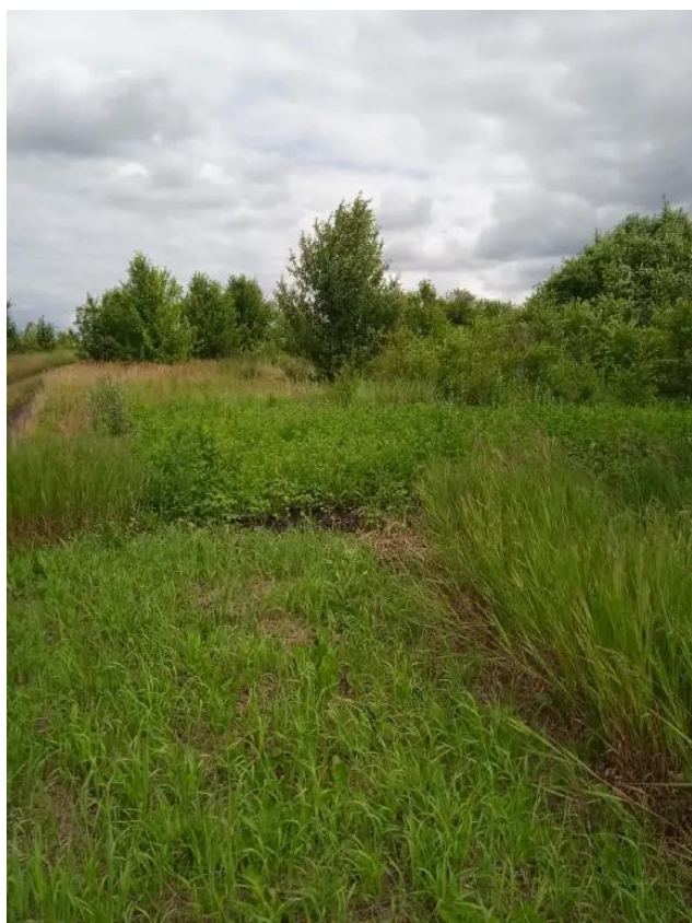
Фото №15. WhatsApp Image 2025-07-10 at 12