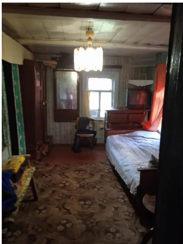
Фото №7. WhatsApp Image 2025-07-10 at 12