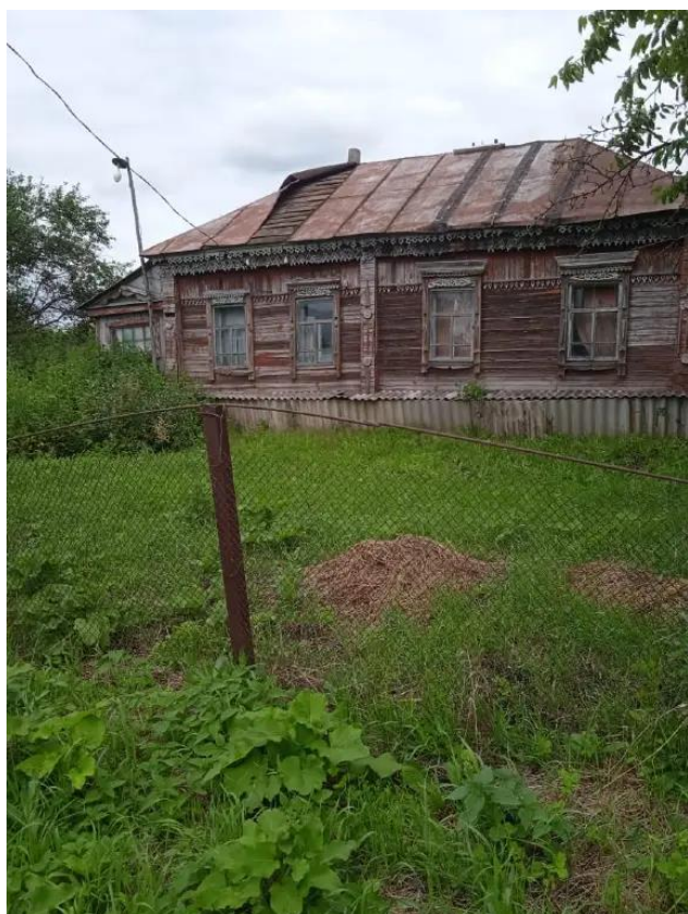
Фото №3. WhatsApp Image 2025-07-10 at 12