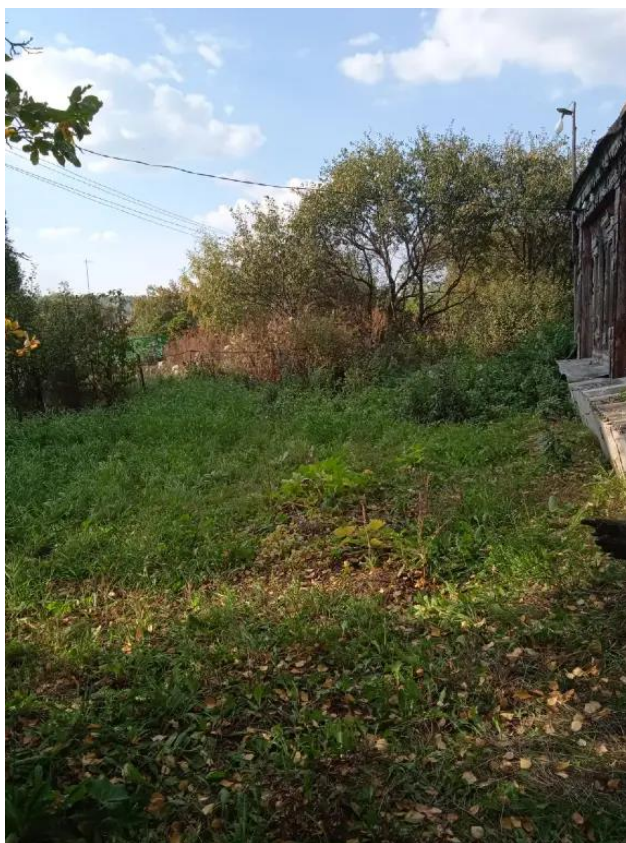
Фото №10. WhatsApp Image 2025-07-10 at 12