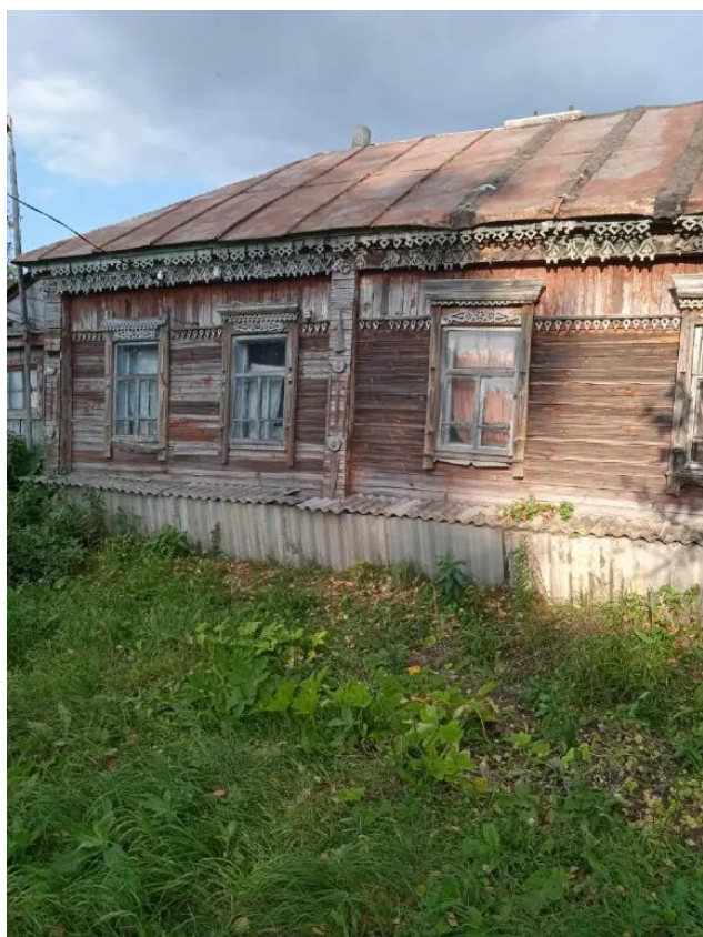
Фото №11. WhatsApp Image 2025-07-10 at 12