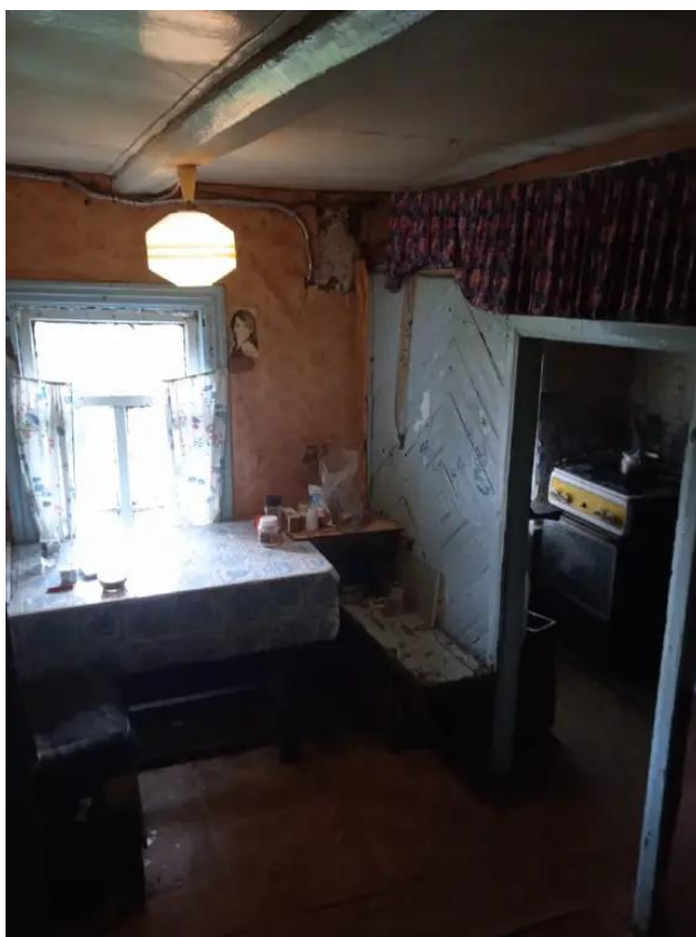
Фото №8. WhatsApp Image 2025-07-10 at 12