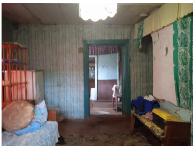
Фото №4. WhatsApp Image 2025-07-10 at 12