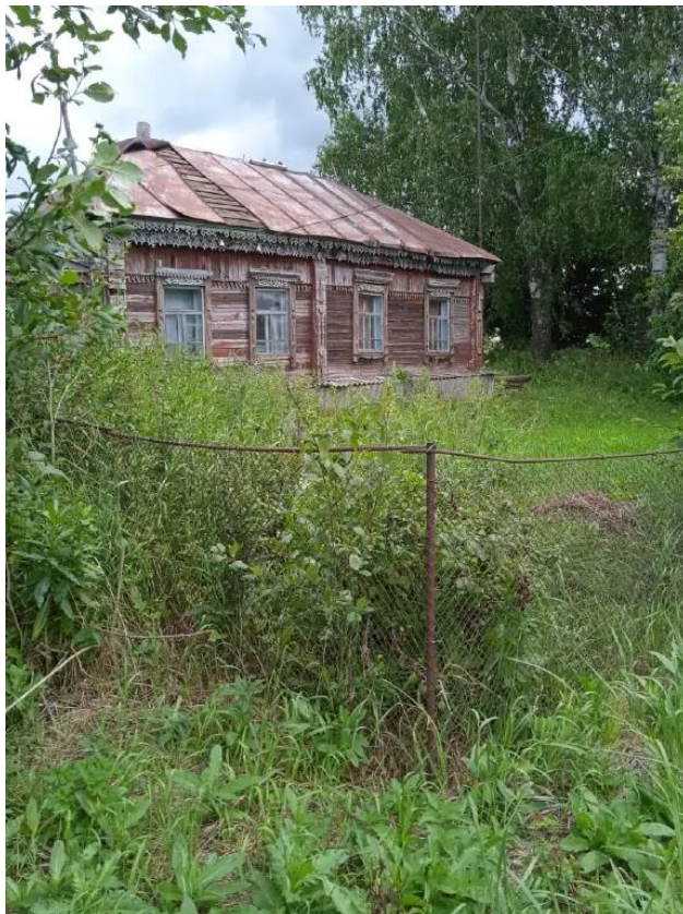
Фото №2. WhatsApp Image 2025-07-10 at 12