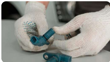
Датчик скорости: как он устроен и почему его надо проверять