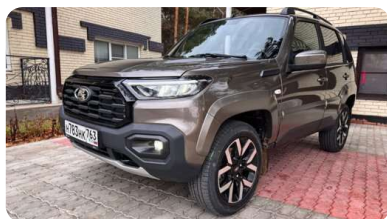
Lada Niva Travel с мощным мотором 1,8: все, что нам известно о новинке