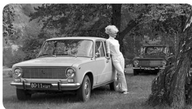
«Мадонна», «Фиалка», «Ильич»: как в СССР выбирали имя «Жигули»