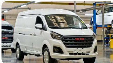
Что это за новая модель АвтоВАЗа со странным названием? 5 фактов